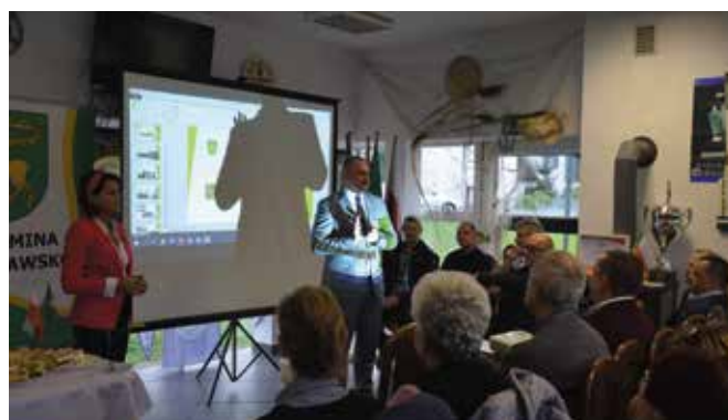
Prezentowano zrealizowane projekty