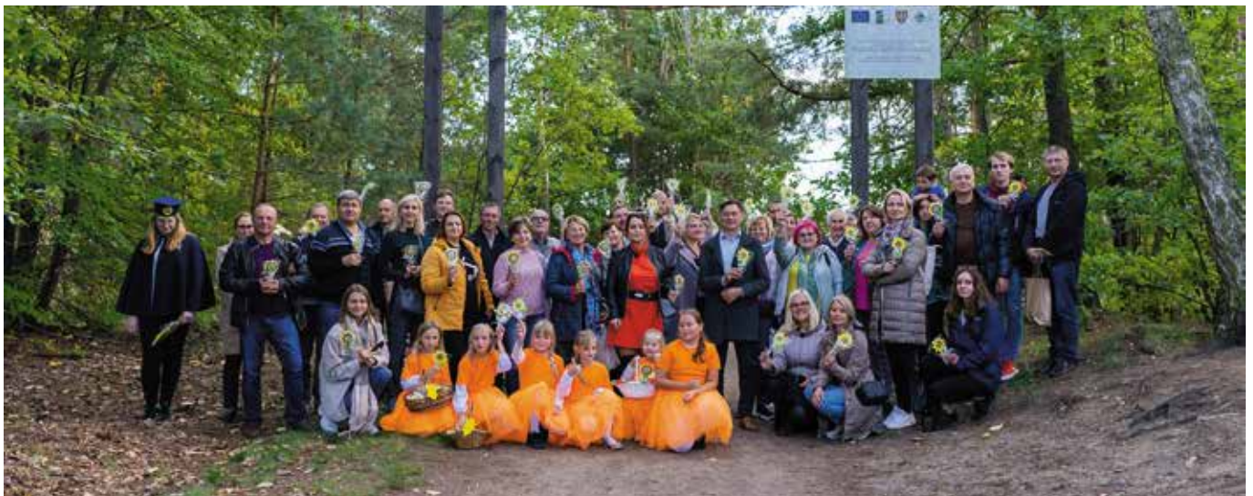
Wizyta w Parku Grzybowym pozostawiła dużo wrażeń i zdjęć