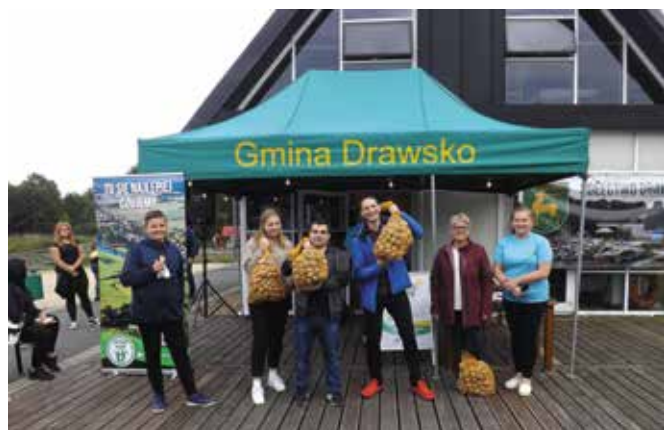
Święto Pyry - Laueaci konkursów z pyry w tle

Warsztaty produkcji zgromadziły około 30 uczestników, głównie dzieci, ale także dorosłych – rodziców i dziadków. Uczestnicy zajęć stworzyli własne mydełka. Mogli wybrać ich kształty, kolory, dodatki, a także zapach. Samodzielna produkcja mydła okazała się nie tylko super zabawą, ale także mini lekcją chemii i fizyki.