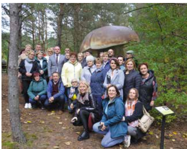
Park Grzybowy w Piłce

Promując gminę zaprezentowaliśmy nasz film promocyjny,