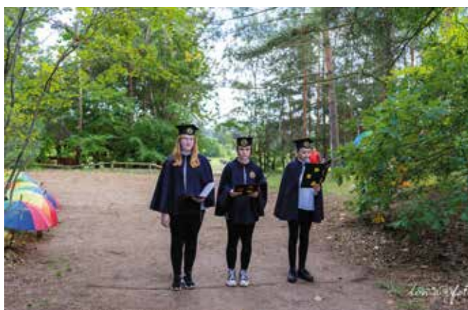
W Parku Grzybowym gości przywitani uczniowie SP w Piłce