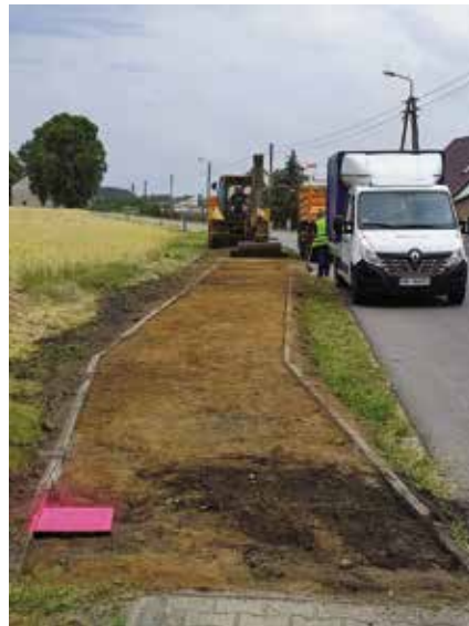
Wykonanie robót ziemnych na ścieżce rowerowej w miejscowości Pęckowo