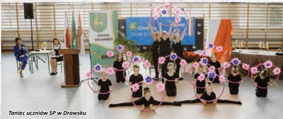
Taniec uczniów SP w Drawsku