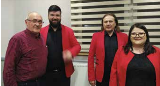
Klubowicze na koncercie SZLAGIEROWO I Z HUMOREM - na zdjęciu z gwiazdami MATEUSZ TROOL I PRZYJACIELE