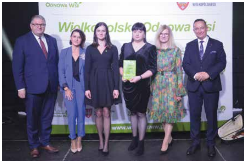
Sołectwo Kamiennik zostało Sołectwem – Laureatem i zyskało nagrodę w wysokości 4 tys. zł