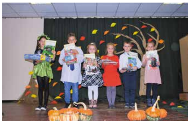
Laureaci w kategorii klasy 1-3