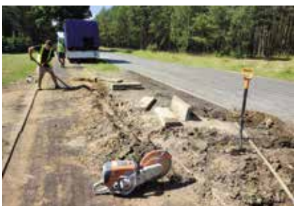
Wykonanie robót ziemnych na ścieżce rowerowej Pęckowo - Piłka