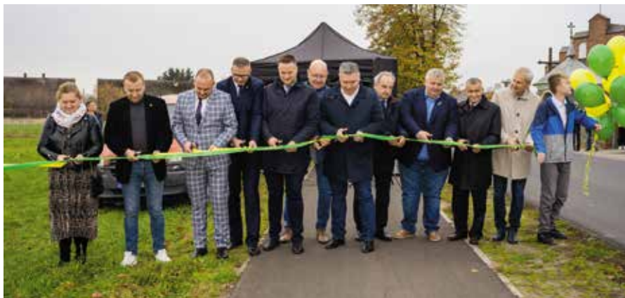
Uroczyste przecięcie wstęgi w Drawsku