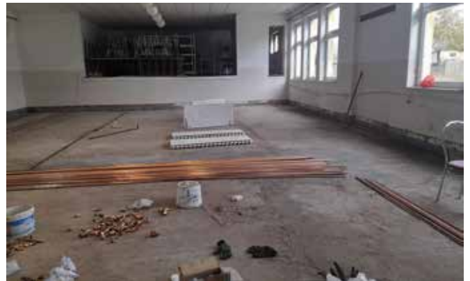
Remont świetlicy wiejskiej w Chełście