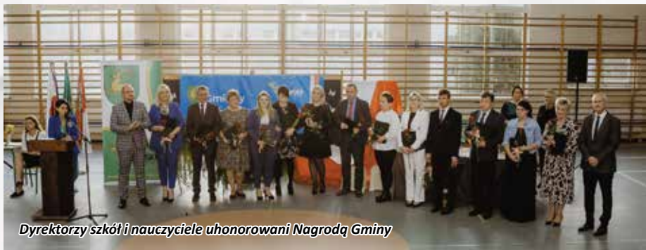
Dyrektorzy szkół i nauczyciele uhonorowani Nagrodą Gminy