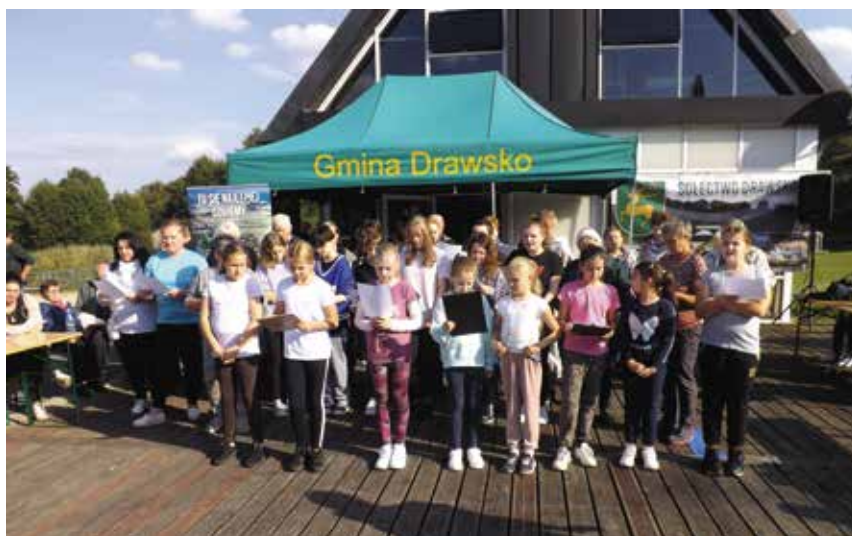
Święto Pyry - Wspólne śpiewanie

dycyjnych drawskich piosenek, był występ wielopokoleniowego chóru, do którego chętnie włączyli się uczestnicy spotkania. I tak na Yndzlu rozbrzmiewały „Droskie zygary”, „Jakie na wsi som zwyczajne” i „Piosenka o Drawsku”. Żywiotowe tańce, „belgijka” i „czekolada”, wykonane przez uczniów naszej szkoły wzbudziły