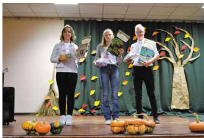
Laureaci w kategorii klasy 7-8