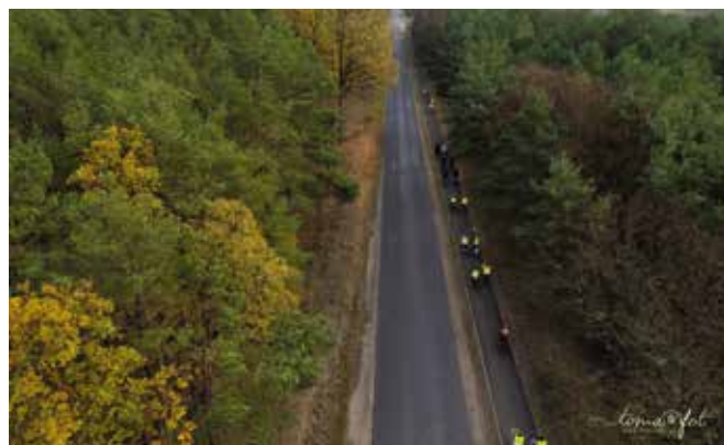
Widok na ścieżkę z drona