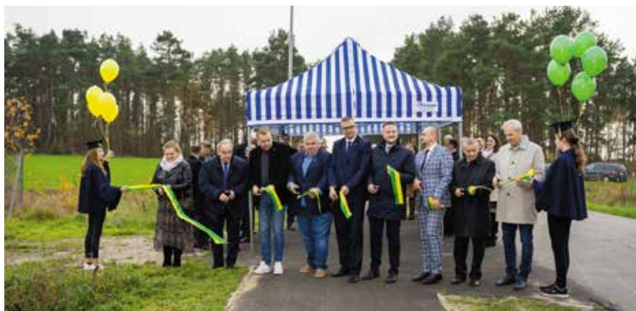
Przecięcie wstęgi w Piłce