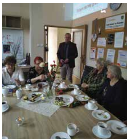
W Klubie Senior+ celebrowujemy Dzień Kobiet wraz z wizytą i życzeniami dla Pań od Wójty Gminy Drawsko