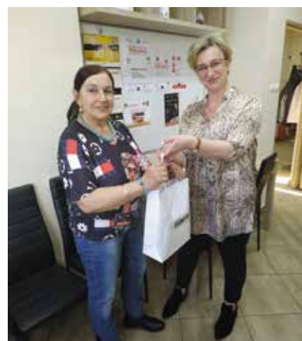
Co tydzień pamiętamy o urodzinach naszych Seniorów