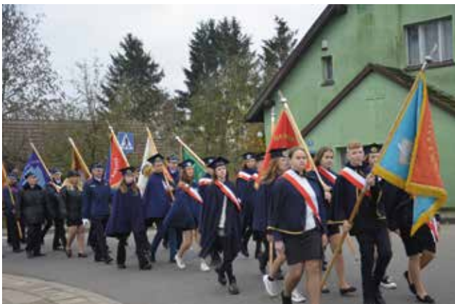
Poczty sztandarowe szkół uczestniczące w obchodach

...Chcę dziś również zaznaczyć, że praca i funkcjonowanie Samorządu Gminy Drawsko, Urzędu, Rady i wszystkich jednostek w związku z zaistniałą sytuacją uległa znacznej zmianie. W dużej