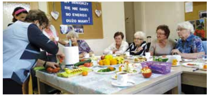
Warsztaty carvingu, czyli dalekowschodnia sztuka rzeźbienia w owocach i warzywach