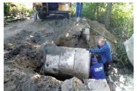
Remont przepustu w miejscowości Piłka