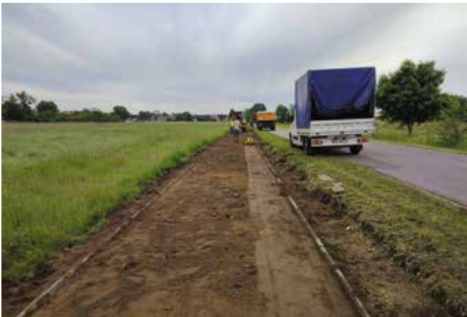
Wykonanie robót ziemnych na ścieżce rowerowej Pęckowo - Drawski Młyn