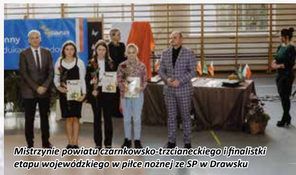
Mistrzyni powiatu czarnkowsko-trzcianeckiego i finalistki etapu wojewódzkiego w piłce nożnej ze SP w Drawsku