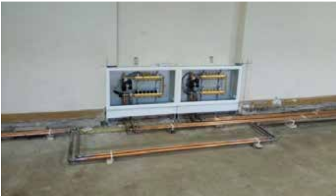
Remont świetlicy wiejskiej w Chełście