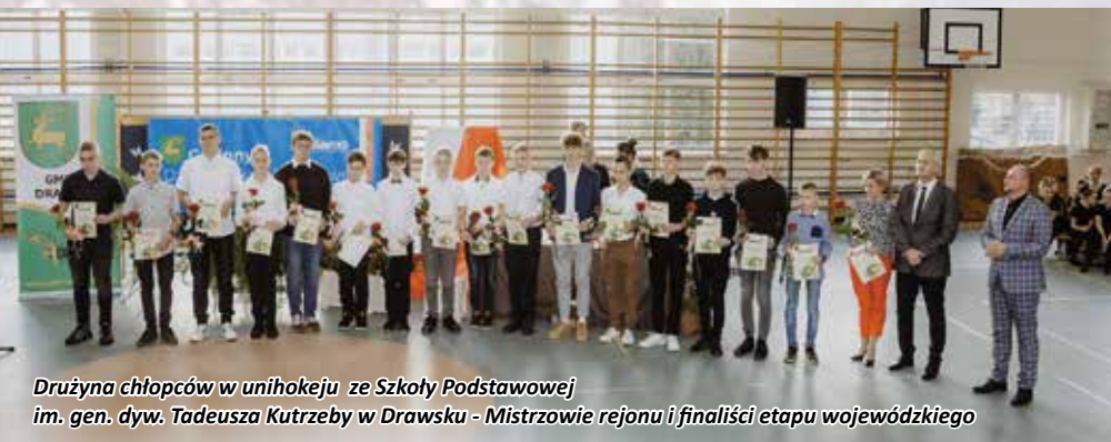
Drużyna chłopców w unihokeju ze Szkoły Podstawowej im. gen. dyw. Tadeusza Kutrzeby w Drawsku - Mistrzowie rejonu i finaliści etapu wojewódzkiego