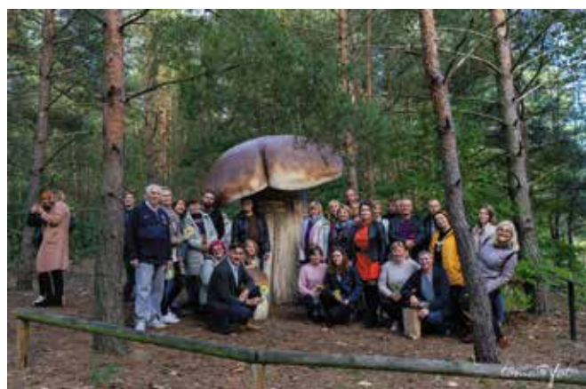
Nie mogło zabraknąć wspólnego zdjęcia przy borowiku