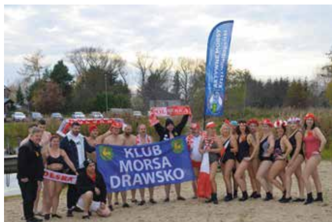
Patriotyczna kąpiel morsów Klubu Morsa Drawsko i Aktywnych Morsów z Krzyża Wlkp.