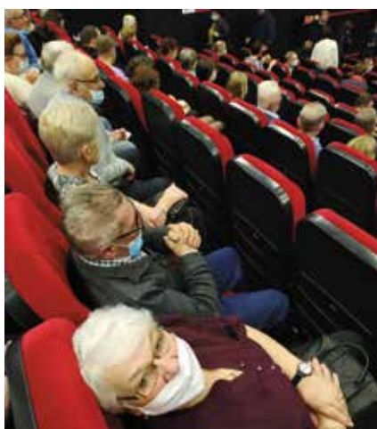
Klubowicze na występie Kabaretu TEY w Czarnkowie