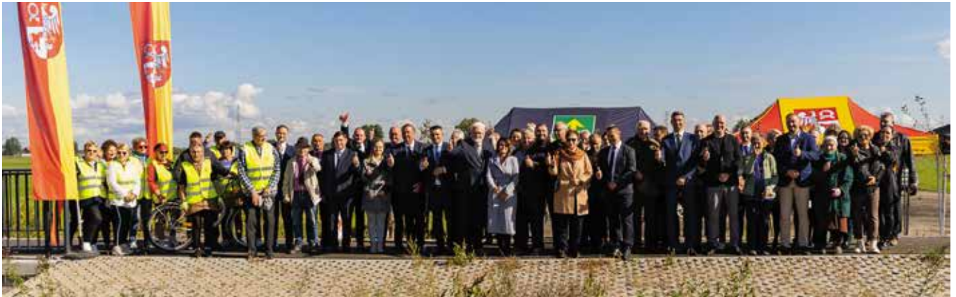
Uczestnicy otwarcia inwestycji

Piątek 23 września 2022 r. godz. 11.00 piękna słoneczna pogoda przywitała wszystkich gości na uroczystym otwarciu historycznej dla nas inwestycji Budowy ścieżki rowerowej między Drawskiem a Krzyżem Wlkp..