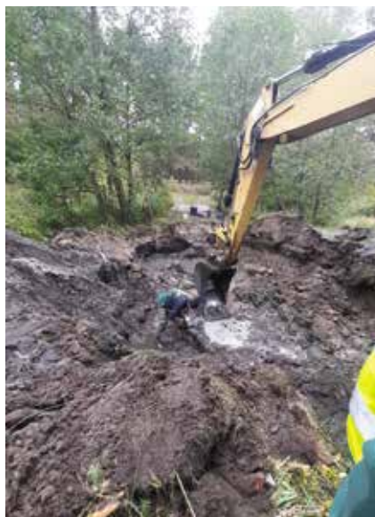
Usuwanie awarii na sieci wodociągowej w Piłce