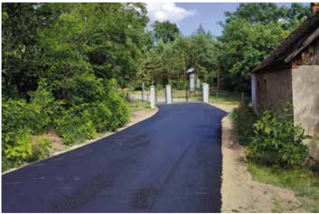
Przebudowa drogi na cmentarz w Piłce