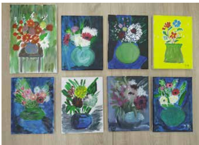
To efekty naszych prac plastycznych

Poniżej przedstawiamy kilka migawek z działalności Klubu Senior+ w Drawsku. Tak było w 2022 r., a już mamy sporo planów na rok 2023.