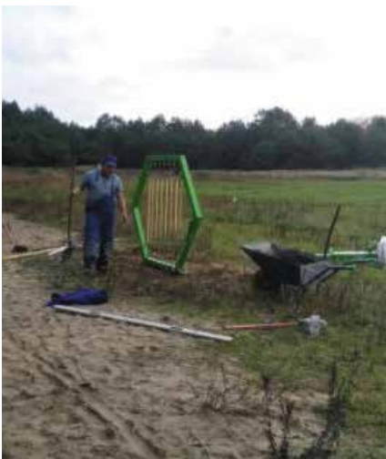
Montaż urządzeń na placu zabaw w Parku Grzybowym w Piłce

„(...) Niechaj ziemię rozśpiewa kołęda, Każdy dom i każdego z nas, Niechaj piękne Bożonarodzeniowe Świeta Niosą wszystkim betlejemski blask.”