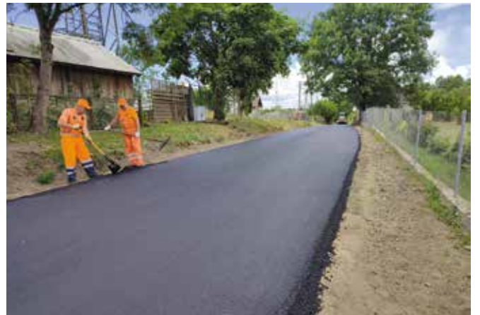
Przebudowa drogi w miejscowości Chelst