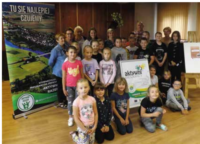
Uczestnicy warsztatów mydlarskich

Ważnym wątkiem spektaklu jest jego aktualność polityczna: pojawiają się tu echa protestów Strajku Kobiet, a także ambiwalentnych relacji Polski z Unią Europejską. Unijna flaga wygania ze sceny flagi biało-czerwone, aktorzy celowo nieudolnie usiłu-