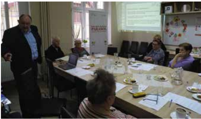
Warsztaty prawno-edukacyjne to trudne tematy, ale bardzo ważna wiedza