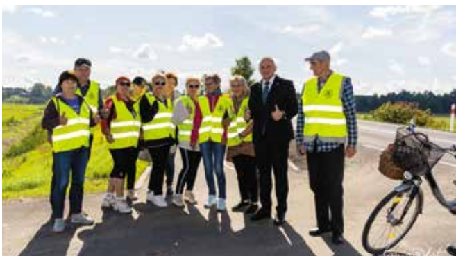
W otwarciu inwestycji udział wzięli rowerzyści Koła Turystyki Rowerowej PTTK – 50 Plus z Drawskiego Młyna