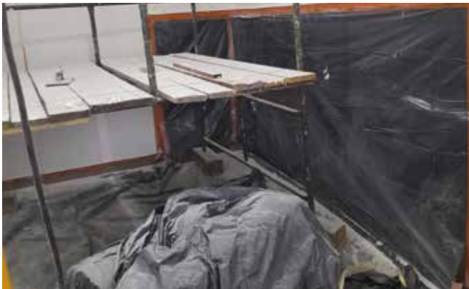
Remont świetlicy wiejskiej w Kamienniku