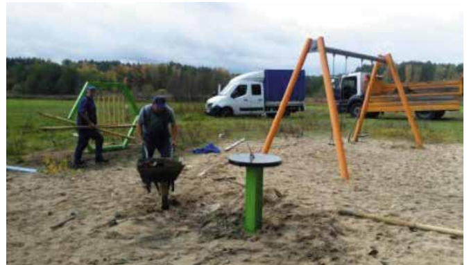
Montaż urządzeń na placu zabaw w Parku Grzybowym w Piłce