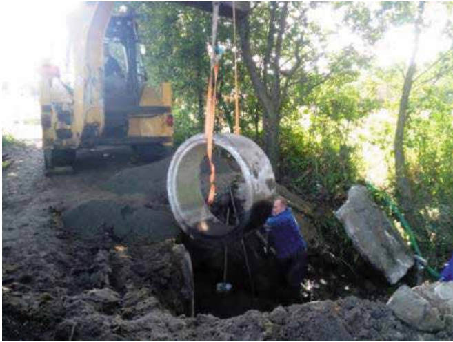
Remont przepustu w miejscowości Piłka