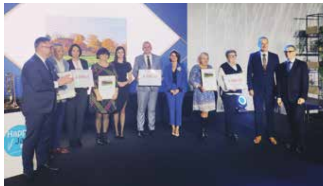
Nagroda za Wieczornicę ku czci Powstańców Wielkopolskich

Wniosek samorządu o nagrodę w XXIII edycji Konkursu Województwa Wielkopolskiego na działania proekologiczne i pro-