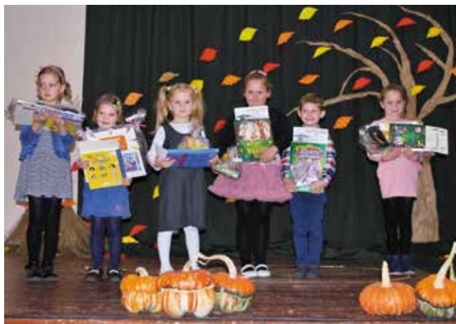
Laureaci w kategorii przedszkole

W piątek, 21 października w Świetlicy Wiejskiej w Pęc-kowie odbył się XIX Gminny Konkurs Recytatorski organizowany przez Świetlicę Wiejską i Bibliotekę Publiczną w Pęc-kowie. Konkurs adresowany był do dzieci z przedszkoli oraz szkół podstawowych z terenu Gminy Drawsko. Celem konkursu było rozbudzenie wrażliwości na piękno słowa oraz rozwijanie dziecięcych talentów i zdolności.