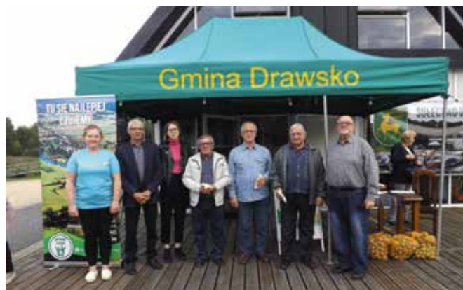
Święto Pyry - Uczestnicy konkursu wiedzy o Drawsku