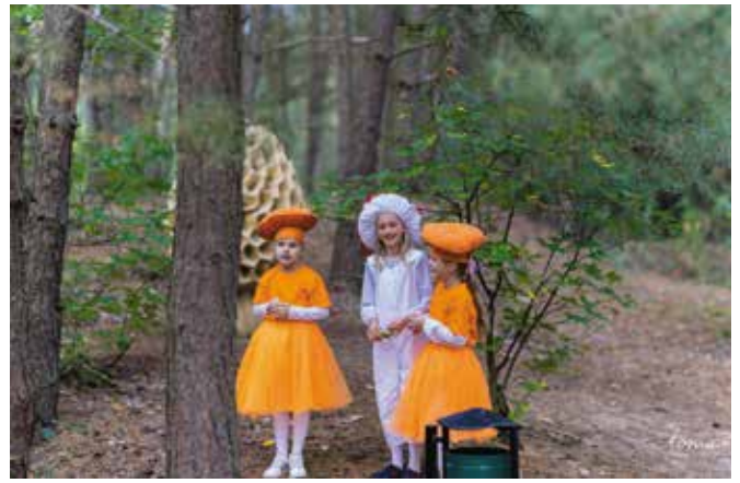
Program artystyczny w wykonaniu uczniów SP w Piłce