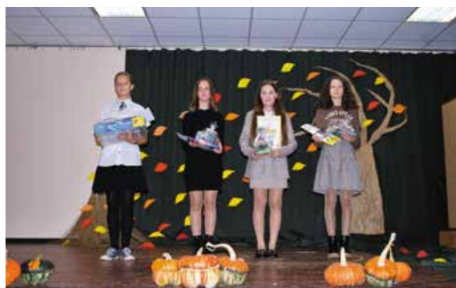
Laureaci w kategorii klasy 4-6