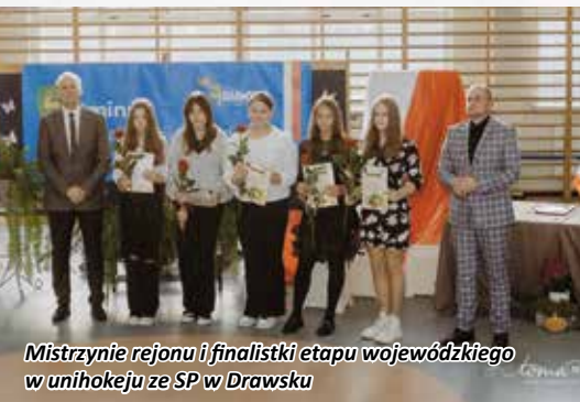
Mistrzyni rejonu i finalistki etapu wojewódzkiego w unihokeju ze SP w Drawsku