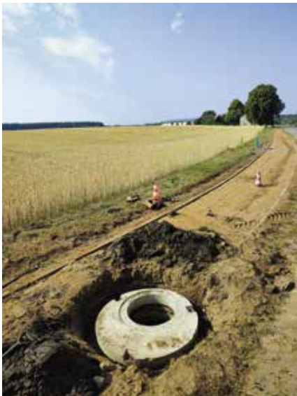
Wykonanie robót ziemnych na ścieżce rowerowej w miejscowości Pęckowo