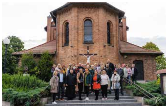
Litewska delegacja zwiedziła zabytkowy Kościół pw. NMP Wniebowziętej w Piłce