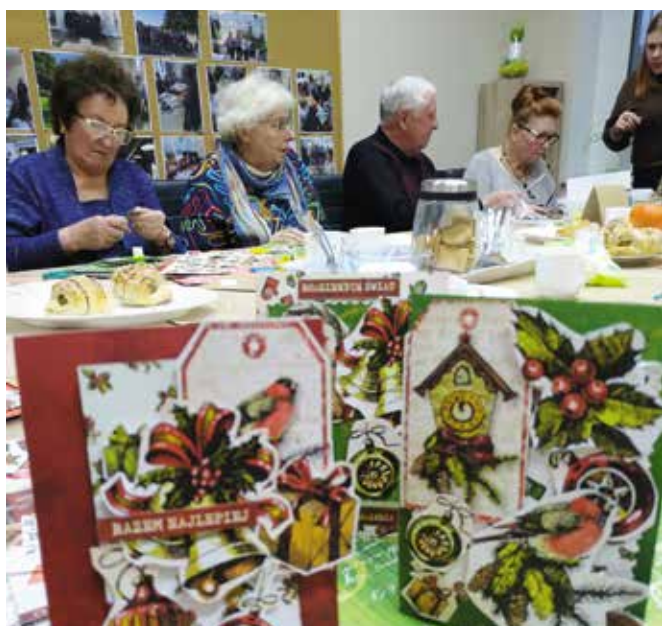
Działamy i rozwijamy się artystycznie, a to nasze własnoręcznie wykonane kartki świąteczne