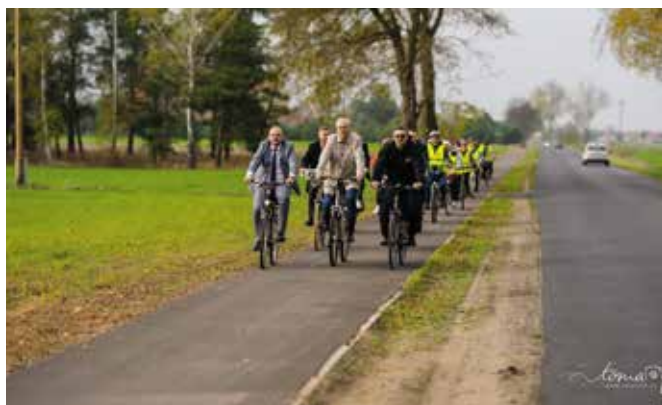
Przejazd ścieżką do Pęcława