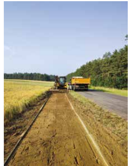
Wykonanie robót ziemnych na ścieżce rowerowej Pęckowo - Piłka