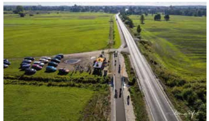
Ścieżka rowerowa Drawsko-Krzyż