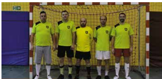
Reprezentacja Gminy Drawsko