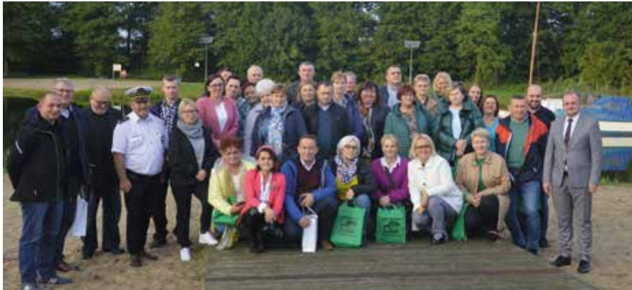
Pamiątkowe zdjęcie na Marinie Yndzel w Drawsku

Dziękuję wszystkim liderom: stowarzyszeń i wsi za to, że poświęcili swój czas. Swoją wiedzą i doświadczeniem przekazali dobre przykłady w Gminie Drawsko.