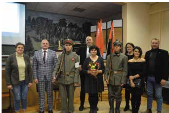
W spotkaniu uczestniczyli przedstawiciele władz Gminy Drawsko

literaturę (w tym słowniki biograficzne opracowane przez Towarzystwo Pamięci Powstania Wielkopolskiego 1918 - 1919 oraz regionalistów z powiatów czarnkowsko-trzcianeckiego i międzychodzkiego), a także ustalenia działaczy zrzeszonych w Wielkopolskim Towarzystwie Genealogicznym „Gniazdo”, upublicznione w internetowych bazach danych, organizatorka wystawy zaprezentowała 46 biogramów mieszkańców Pęcokowa, którzy wpisali się w dzieje walk o wyzwolenie Wielkopolski. Jako ochotnicy, bądź też jako żołnierze regularnych formacji wojskowych, wzięli udział w Powstaniu Wielkopolskim i wielomiesięcznym konflikcie na pograniczu polsko-niemieckim, zakończonym dopiero w styczniu 1920 roku, wraz z ostateczną ratyfikacją traktatu wer-