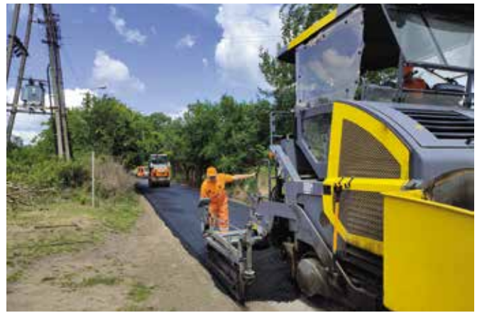
Przebudowa drogi w miejscowości Chelst