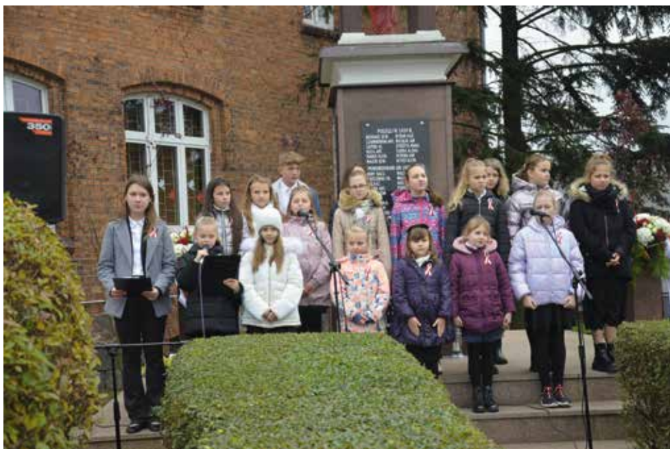
Program artystyczny uczniów Szkoły Podstawowej im. gen. dyw. Tadeusza Kutrzeby w Drawsku

Druga część Święta Niepodległości miała miejsce na marinie Yndzel w Drawsku, gdzie Stowarzyszenie „Klub Morsa Drawsko” wraz z „Aktywnymi Morsami Krzyż Wlkp.” oddali patriotyczną kąpiel w barwach biało-czerwonych.