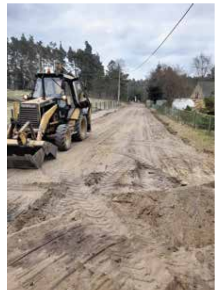
Przebudowa drogi na cmentarz w Piłce