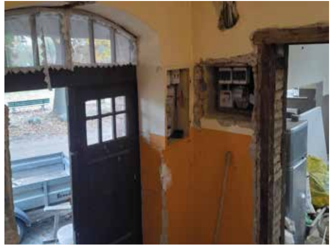
Remont świetlicy wiejskiej w Kamienniku