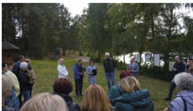
Wizyta rozpoczęła się od zwiedzenia Marylińskiego Świata Ryb