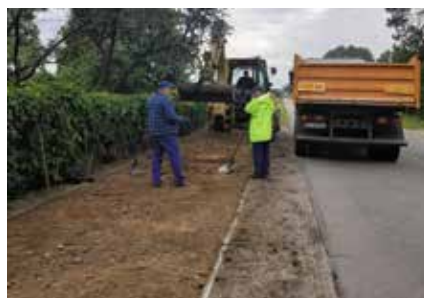
Wykonanie robót ziemnych na ścieżce rowerowej w miejscowości Pęckowo