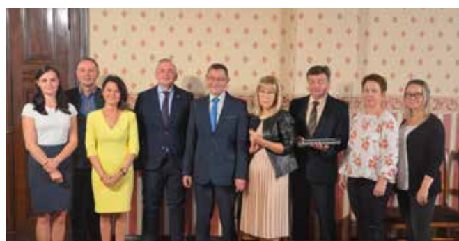
Sprzęt odebrali dyrektorzy szkół Gminy Drawsko