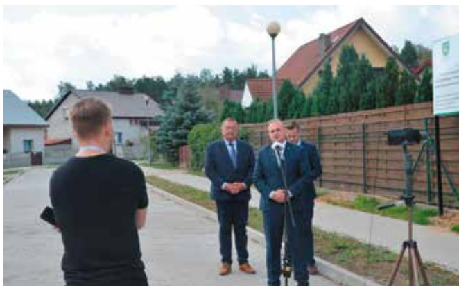
Obecność na wybudowanej ul. Płk. Szacherskiego była okazją do zorganizowania konferencji prasowej dla Radia Poznań i udzielenia wywiadu przez Posła, Wójta Gminy Drawsko i Radnego Sejmiku Województwa Wielkopolskiego

Po objeździe tak kluczowych dla Gminy Drawsko inwestycji zaprosiliśmy gości do Klubu Senior+. Pamiętacie Państwo pisaliśmy o tej inwestycji wykonanej dzięki dofinansowaniu z Programu Senior+ w grudniu ubiegłego roku. Dzięki tym środkom udało nam się wyremontować i wyposażać pomieszczenia oddane z wynajmu przez Poczta i urządzić miejsce spotkań dla