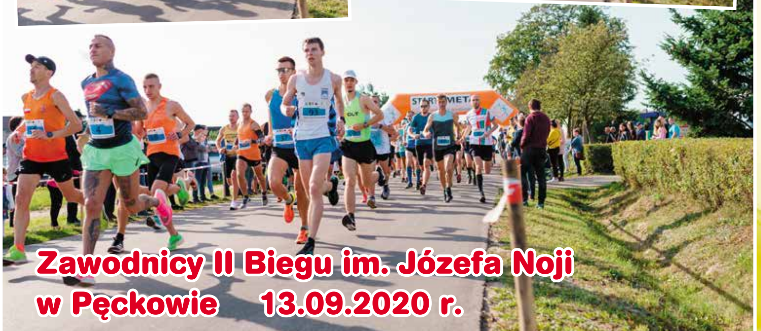
Zawodnicy II Biegu im. Józefa Noji w Pęckanie 13.09.2020 r.