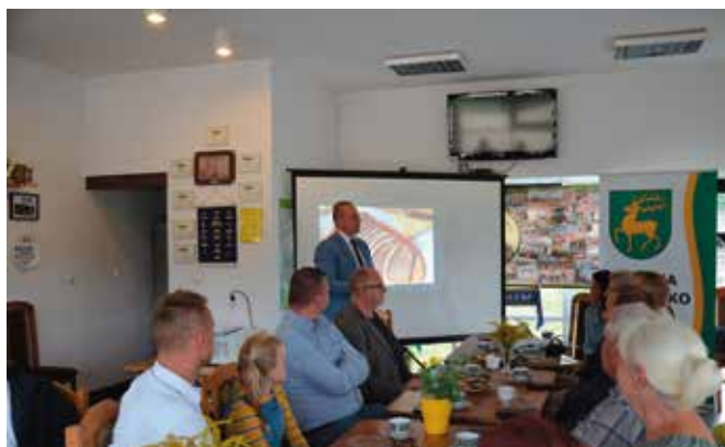
Wójt Gminy Drawsko dziękował za zaangażowanie i wykonaną pracę