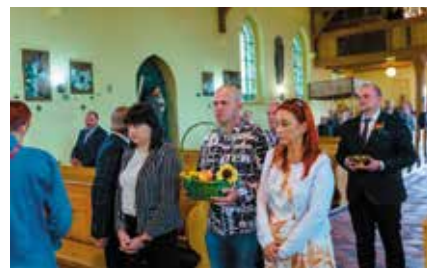
Sołectwa Kawczyn, Kamiennik i Kwiejce przekazały na ręce Księdza owoce, Wójt z Sołtysiem Drawsko wino i hostię