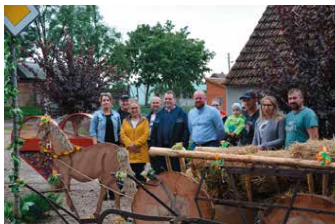
Zwycięzca I miejsca – Sołectwo Chełst