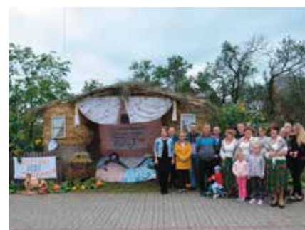
Witacz Sołectwa Moczydła