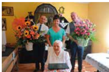
Jubilatka z Wójtem, Sołtysem wsi Kawczyn oraz Kierownikiem USC w Drawsku

„Życ należy każdą chwilą i dbać o to, by przeżyć ją w sposób najbardziej pełny i przyjemny” (Epikur)