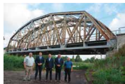
Wizyta na dworcu kolejowym w Drawskim Młynie