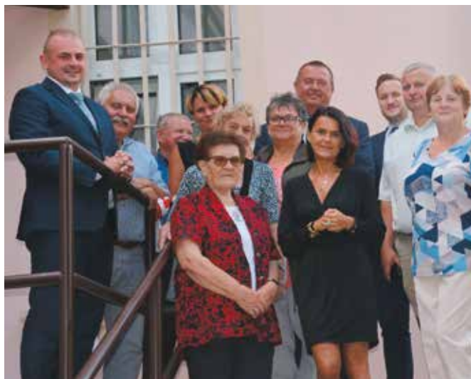
Pamiątkowe zdjęcie z Seniorami