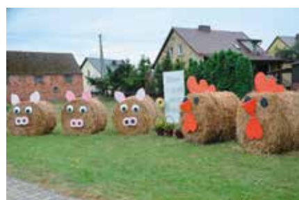
Witacz Stowarzyszenia „Złote Lata” z Pęckowa