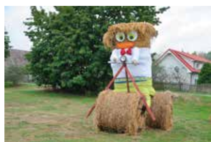
Witacz wykonany przez jednostkę OSP Kawczyn