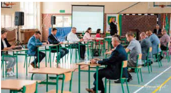
Sesja absolutorijna, 24 czerwca 2020 r.