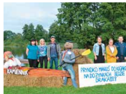
Witacz Stowarzyszenia „Nasza Wieś Naszym Domem” z Kamiennika