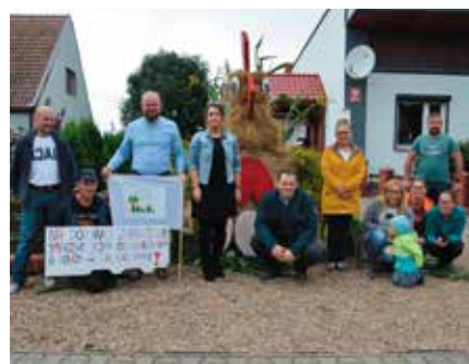
Witacz Stowarzyszenia „Młodzi dla Wsi” z Chełstu