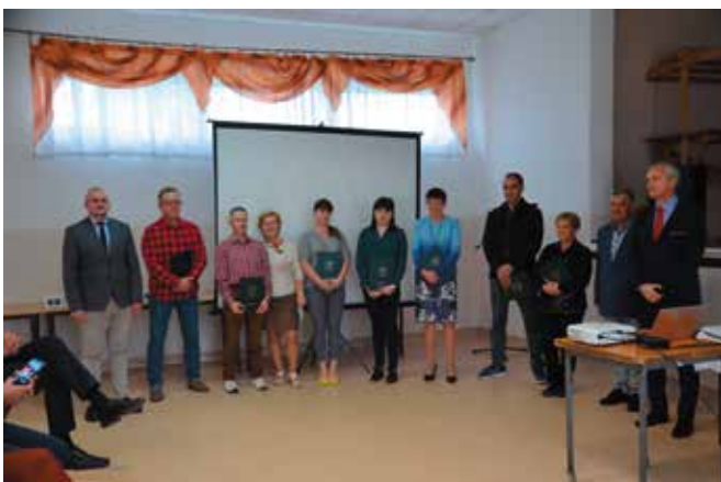
Nagrodzeni - Piękna wieś działem jej mieszkańców - Zagroda nierolnicza