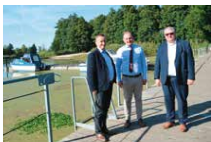
Goście odwiedzili marinę „YNDZEL” w Drawsku

Pamiętacie Państwo jak opisywaliśmy inwestycję, która zdecydowanie polepszyła naszą infrastrukturę i dała możliwość poruszania się rolnikom ciężkim sprzętem omijając drogę wojewódzką. Przypomnę, że zadanie to zrealizowaliśmy dzięki niebagatelnemu dofinansowaniu Województwa Wielkopolskiego w kwocie 700 tys. zł przy całkowitej wartości niespełna 1mln 250 tys. zł.