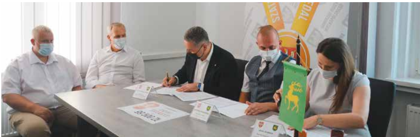
Podpisanie umowy na dofinansowanie „Remontu zaplecza (ogólnodostępnego) sanitarno-szatniowego w Gminnej Sali Gimnastycznej w Drawsku” w ramach programu „Szatnia na medal” realizowanego przez Wielkopolski Urząd Marszałkowski