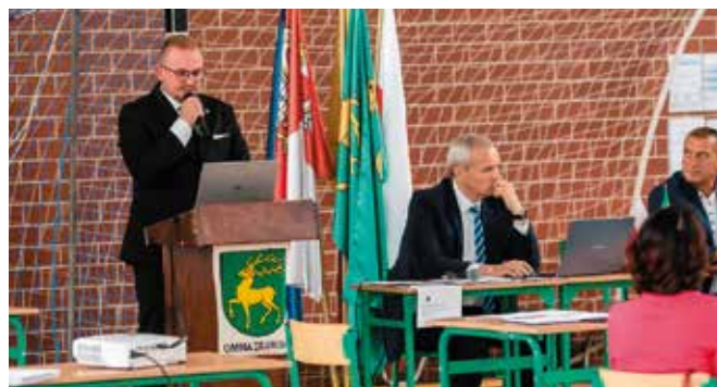
Podczas sesji absolutoryjnej Wójt zaprezentował Raport o stanie Gminy Drawsko za 2019 r.

Z prac w okresie międzysesyjnym Wójt Gminy odniósł się do: - stanu epidemiologicznego na terenie Gminy Drawsko spowodowanego wirusem COVID 19: liczba osób z dodatnim wynikiem oraz