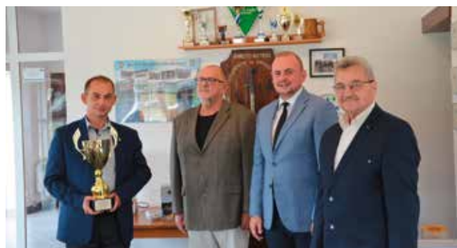
Zdobywca I miejsca Sołectwo Kawczyn

„Jak zawsze mogę na Was liczyć i jak zawsze nasza współpraca daje tylko pozytywne efekty. Mimo początkowego oporu, kiedy przedstawiałem pomysł na kolejny turniej, stanęliście na wysokości zadania wręcz ścigając się w pomysłach jak pokazać sołectwa. Za to Wam bardzo dziękuję.”