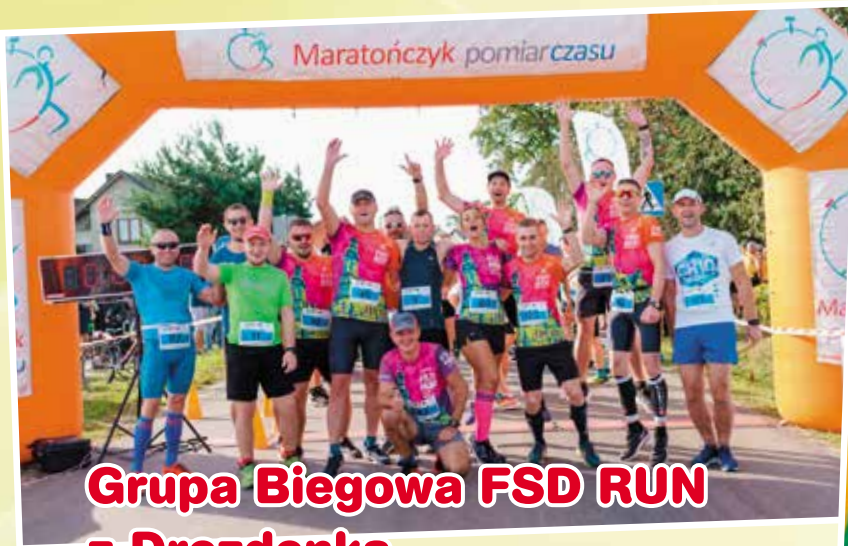
Grupa Biegowa FSD RUN z Drezdenka