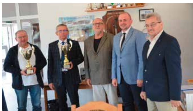
II miejsce zdobyło Sołectwo Moczydła i Kwiejce Nowe