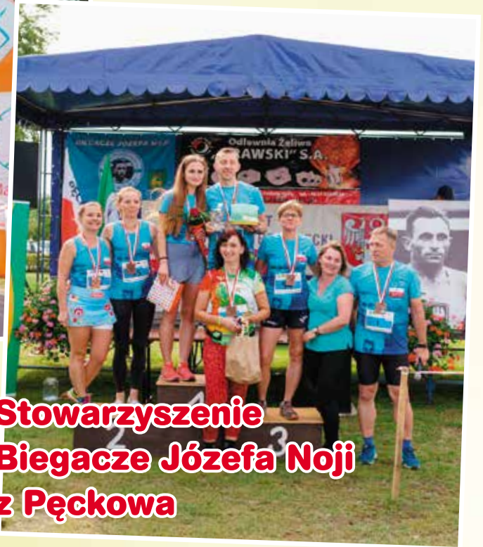
Stowarzyszenie Biegacze Józefa Noji z Pęckowa