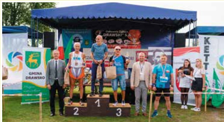
Dekoracja mężczyzn w najstarszej kategorii 70+

ISSN 1644-6011 • Październik 2020 • Egzemplarz bezpłatny • www.gminadrawsko.pl • Nr 2/2020