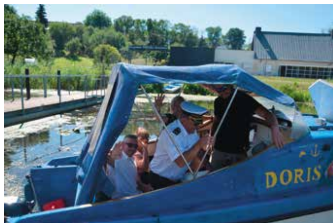
Spotkanie zakończyło się rejsem po Noteci