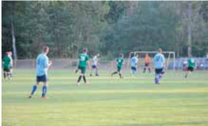
Mecz byłych zawodników Sokola Drawsko z B klasową drużyną Noteć Rosko