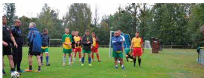
Zawodnicy II turnieju