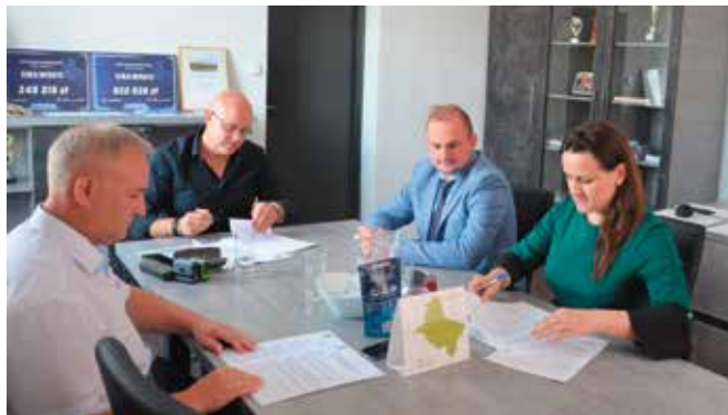
Podpisanie umów z wykonawcą inwestycji - firmą VIABUD Sp. z o.o. Sp. k. w Walkowicach

23 lipca 2020 roku w siedzibie Urzędu Gminy w Drawsko miało miejsce podpisanie umów na realizację zadań: - Przebudowa drogi gminnej wraz z odwodnieniem - ulicy Płk. Królickiego w miejscowości Drawsko w gminie Drawsko, - Przebudowa drogi gminnej wraz z odwodnieniem - ulicy Leśnej w miejscowości Drawski Młyn w gminie Drawsko.