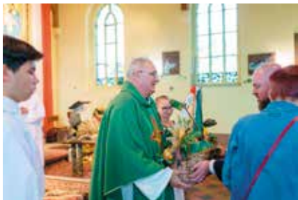
Sołtys Chełstu i Pęczy przekazali w darach warzywa