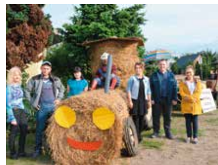
Witacz Sołectwa Kamiennik