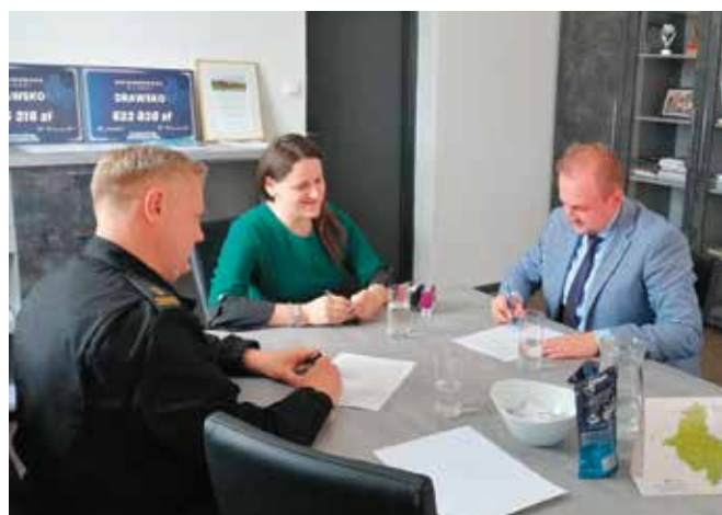
Podpisanie umowy na zakup dwóch kamer termowizyjnych