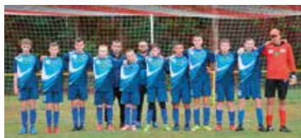
Zwycięska drużyna Turnieju reprezentacja Gminy Drawsko

Po rozstrzygnięciu wszystkich pojedynków przystąpiono do ceremonii podsumowania zawodów. Prowadzący