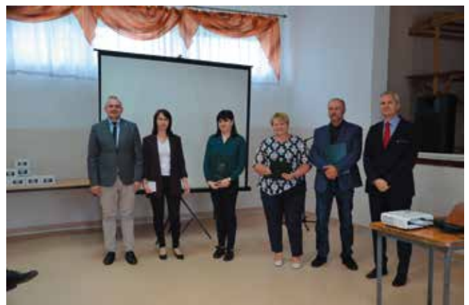
Nagrodzeni - Piękna wieś działem jej mieszkańców - Zagroda rolnicza