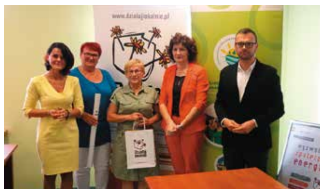
Stowarzyszenie Klub Seniora „ZŁOTE LATA” Tytuł projektu: „Pęcokowo łączy pokolenia - warsztaty kulinarne, jako działanie zmniejszające negatywne skutki epidemii”