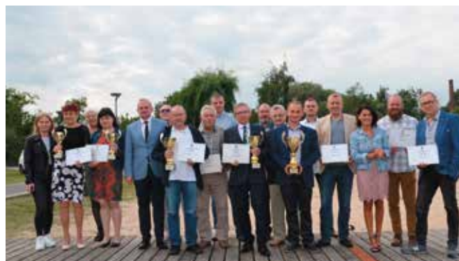
Pamiątkowe zdjęcie zakończyło spotkanie