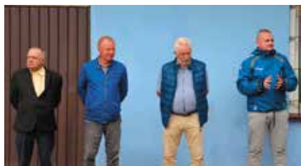
Zarząd Powiatowego Zrzeszenia LZS

W turnieju uczestniczyły 3 drużyny: Gmina Lubasz, która na turnieju wojewódzkim w Ostrowie Wielkopolskim dnia 25 czerwca 2020 roku wywalczyła 2 miejsce; Gmina Czarnków reprezentowana przez zawodników z Jędrzejewa oraz gospodarze – Gmina Drawsko, reprezentowana przez zawodników miejscowego „Sokoła”.