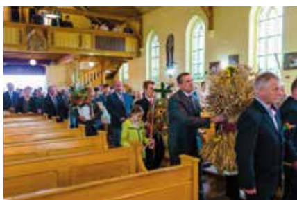
Dary do ołtarza przynieśli rolnicy oraz sołtysi Gminy Drawsko