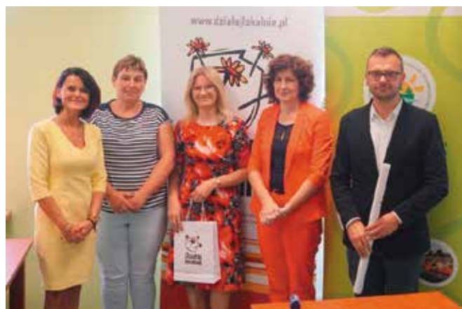
Stowarzyszenie „ Nasza Wieś Naszym Domem ” Tytuł projektu: „ Roboto COVID-owa przygoda ”