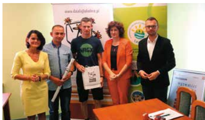
Ochotnicza Straż Pożarna Kawczyn Tytuł projektu: „Straż z Kawczyna daje radę i seniorom w czasie COVID skosi trawę!”