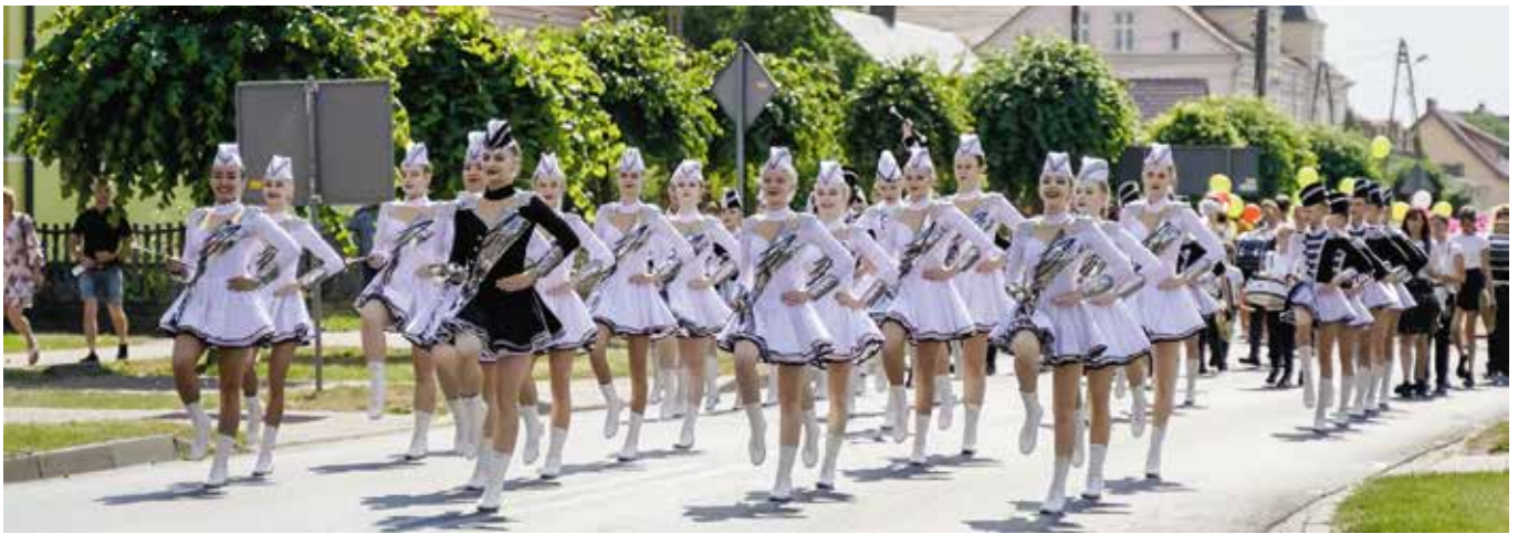
Dni Gminy Drawsko 2022 - XXII Odlotowy Festyn Grzybowy „Grzyby, ryby, las wokół nas”

W minionej kadencji ewaluowała również organizacja dożynek gminnych , święto ważne nie tylko dla rolników, ale również