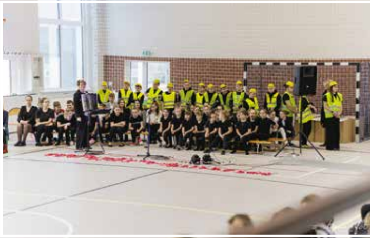
Inscenizacja przygotowana przez uczniów SP w Drawsku