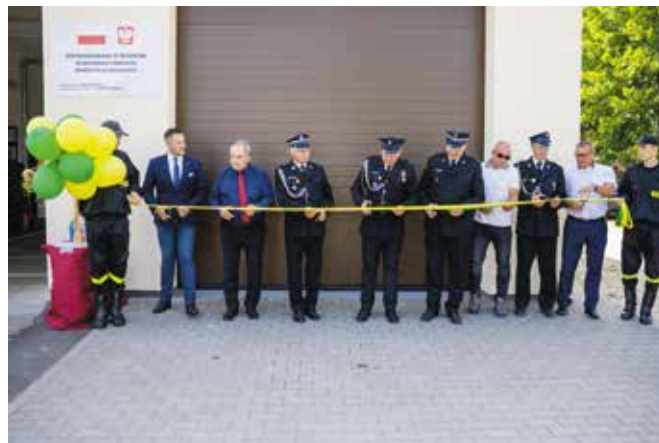
100-lecie OSP Pęckowo oraz otwarcie rozbudowanej remizy strażackiej w Pęcownie 2023r.

wraz z nadzorem obiektów rekreacyjno-sportowych, takich jak: marina „Yndzel” w Drawsku, Hala Sportowa w Drawsku, boiska przyszkolne i boisko sportowe „Orlik”, świetlice i biblioteki.