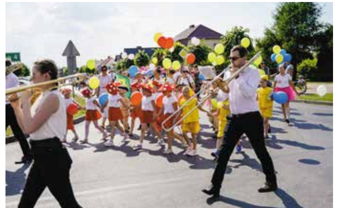
Dni Gminy Drawsko 2022 - XXII Odlotowy Festyn Grzybowy „Grzyby, ryby, las wokół nas”