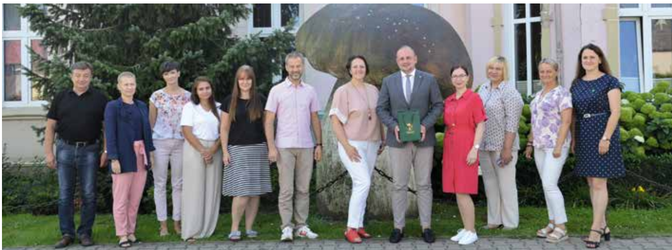
Wizyta robocza partnera litewskiego z Lazdijų Motiejaus Gustaičio Gimnazja z dyrektorem i nauczycielami SP w Drawsku, 22.08.2023r.

Początek pierwszych naszych działań to wizyta polskiej delegacji w Lazdijai we wrześniu 2019r. W tym samym roku, w listopadzie tego samego roku odbyła się rewizyta litewskiej delegacji w naszej gminie. Ustalono wówczas wstępny zarys partnerskiej umowy oraz zapoznano gości z regionem Gminy Drawsko.