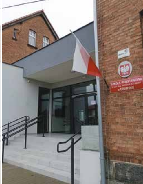
Wejście przez nową część budynku SP w Drawsku