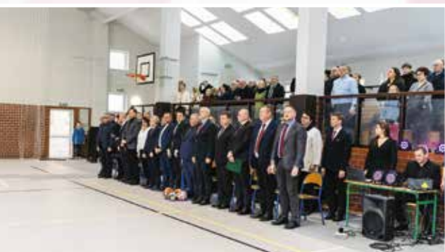
Zgromadzeni mieszkańcy i goście