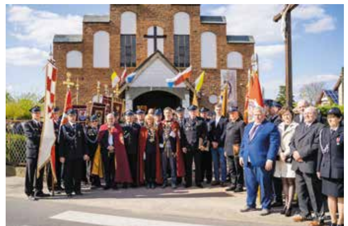
Wprowadzenie Relikwii Świętego Floriana do Kościoła w Drawsku 2023r.