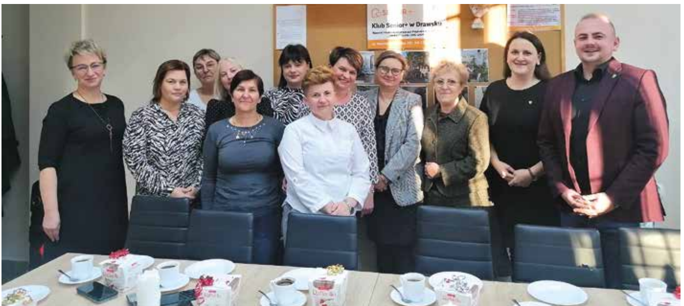
Obchody Dnia Pracownika Socjalnego 2022r.