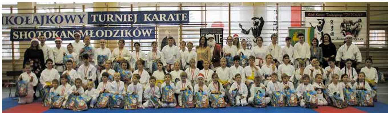
Mikołajkowy Turniej Shotokan Młodzików 2022r.

Samorząd Gminy Drawsko bardzo aktywnie wspiera i współpracuje ze Stowarzyszeniami Gminy Drawsko , a mamy ich dużo, bo prawie 30. W 2021 roku odbyło się po raz pierwszy wielkie święto Józefa Noji – impreza sportowa – Bieg im. Józefa Noji kontynuowana już cyklicznie przez Stowarzyszenie Biegaczy Józefa Noji z Pęckowa i Samorząd Gminy Drawsko. W kalendarzu imprez stałe miejsce zajmuje „Święto Pyry” organizowane przez Sołectwo Drawsko i Stowarzyszenie „Aktywni Razem”. Tradycją już stał się Mikołajkowy Turniej Karate Shotokan Młodzików organizowany przez MUKKT Fudokan. Z szeregiem lokalnych inicjatyw wychodzą również pozostałe aktywnie działające w ciągu całego roku Stowarzyszenia.