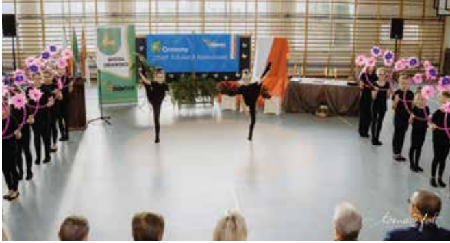
Gminny Dzień Edukacji Narodowej 2022r.