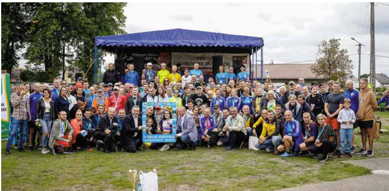
IV Bieg im. Józefa Noji w Pęcownie 2022r.