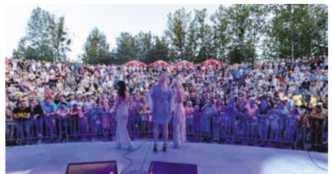
Dni Gminy Drawsko 2019 - XX Odlotowy Festyn Grzybowy „Grzyby, ryby, las wokół nas”. Publiczność drawskiego amfiteatru podczas koncertu „Top Girls”