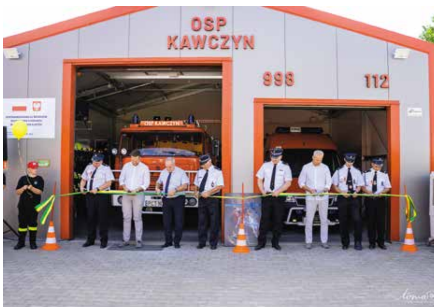
Otwarcie nowej remizy strażackiej w Kawczynie 2023r.