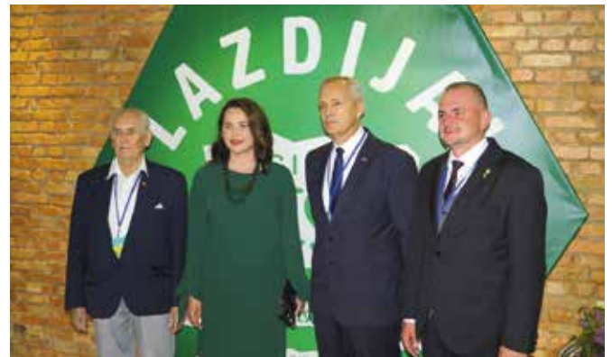
Delegacja Gminy Drawsko z Mer Rejonu Łazdijai, Fiesta Pogranicza 04.06.2022r.