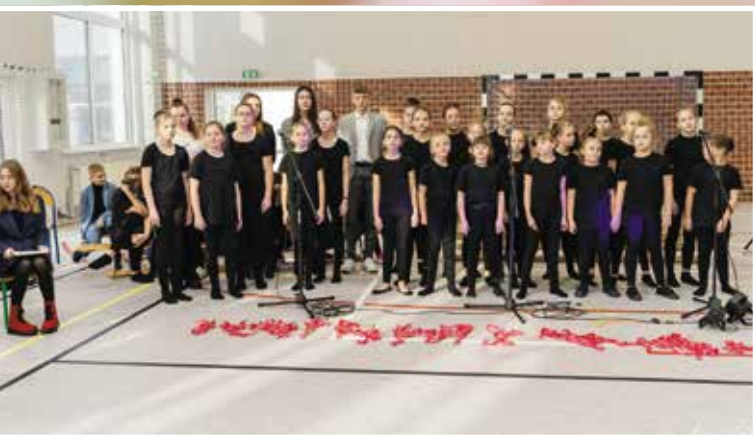
Umiejętności wokalne prezentował chór uczniów SP w Drawsku