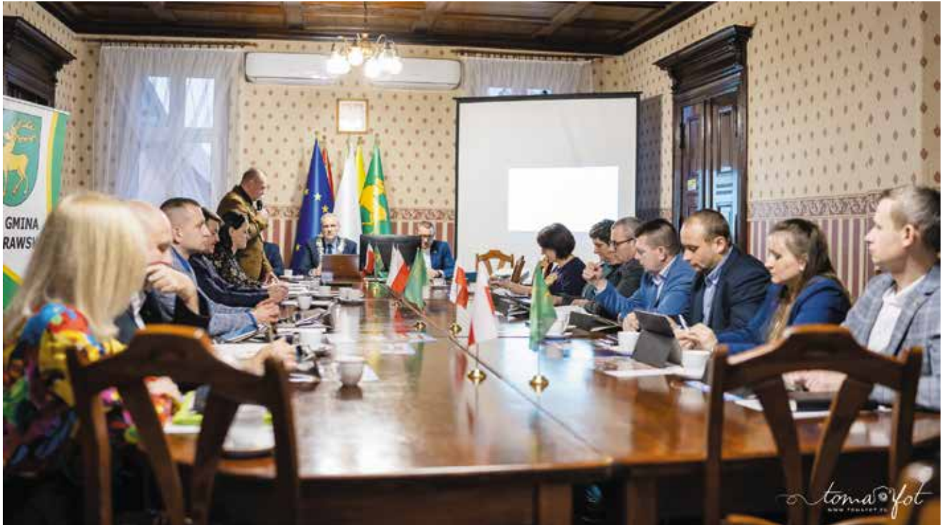
LVII sesja Rady Gminy Drawsko, 09.02.2024 r.