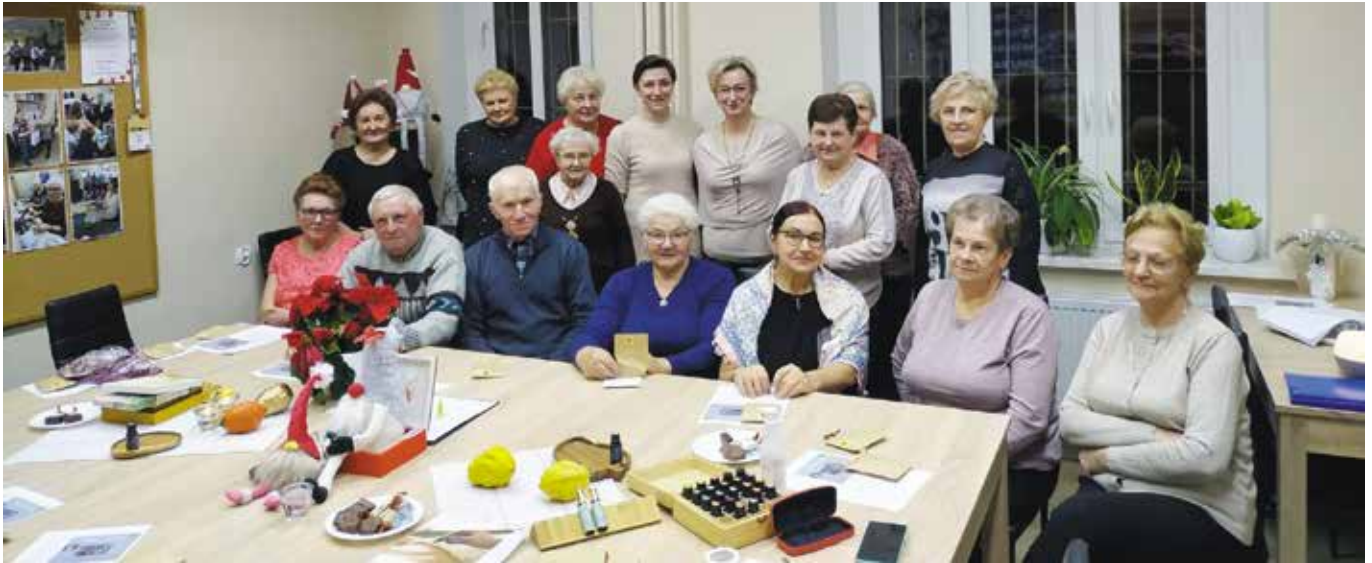
Zajęcia aromaterapii w Klubie Senior+ 2023r.

na rola opiekunek środowiskowych. Opiekunki środowiskowe to osoby, które swą pracą opiekuńczą wspomagają naszych mieszkańców w domach. W 2019 powołano w naszej gminie ośrodek wsparcia dla mieszkańców w wieku powyżej 60 lat, jakim jest Klub Senior+. Klub ma swoją siedzibę w Drawsku, a powstał dzięki znacznemu wsparciu środków pieniężnych z budżetu państwa i prężnie działa do dziś. Od 2021 w rodzinach pracuje asystent rodziny, pełniący bardzo ważną rolę wspomagającą rodziny, które wychowują