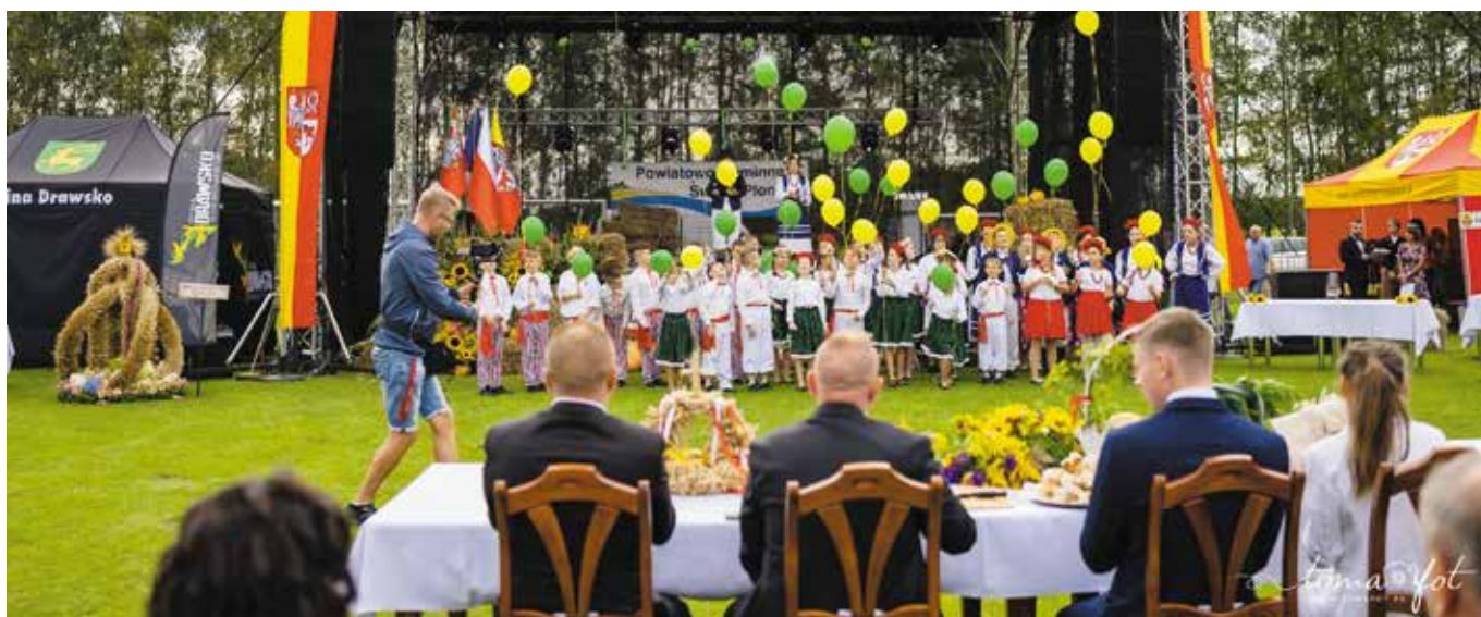
Powiatowo-Gminne Święto Plonów, Pęcokowo 2023r.