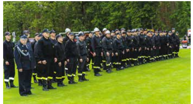
Dzień Strażaka, Drawsko 2022r.

Od 1 stycznia 2024 r. swoją działalność rozpoczęło Centrum Kultury w Drawsku , które ma rozwijać różne obszary kultury, bibliotek, sportu, turystyki i rekreacji drawskiego samorządu