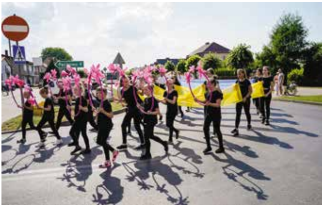
Dni Gminy Drawsko 2022 - XXII Odlotowy Festyn Grzybowy „Grzyby, ryby, las wokół nas”