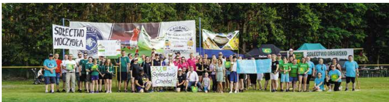
Dni Gminy Drawsko 2022 - VII Samorządowy Turniej Sołectw Gminy Drawsko