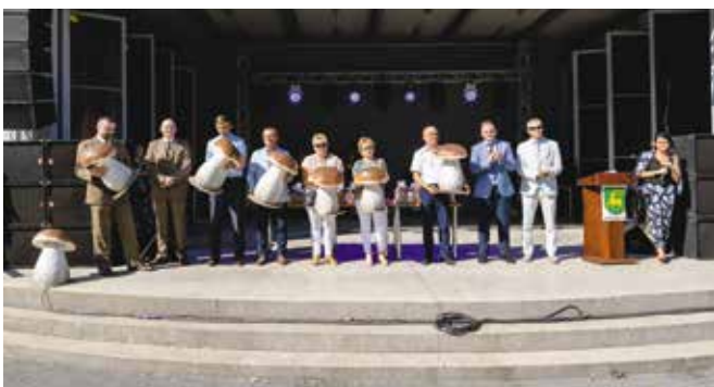
Dni Gminy Drawsko 2019 - XX Odlotowy Festyn Grzybowy „Grzyby, ryby, las wokół nas”. Nagrodzeni przedstawiciele firm i instytucji, którzy wspierali imprezę przez minione lata