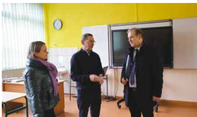
Dyrektor SP w Piłce podczas wizyty delegacji