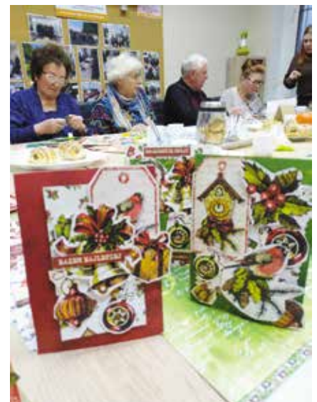
Kartki świąteczne wykonane przez Seniorów