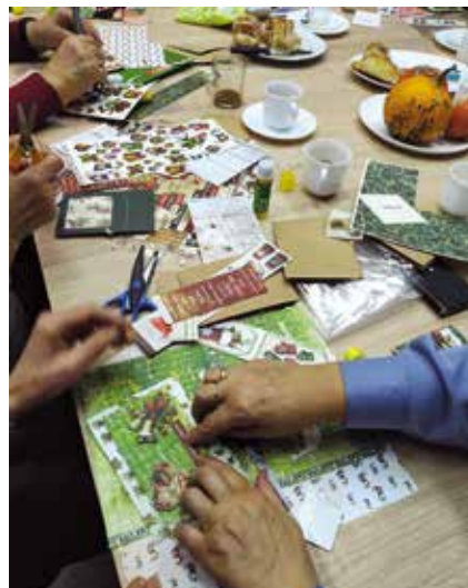
Warsztaty plastyczne – wykonywanie kartek świątecznych