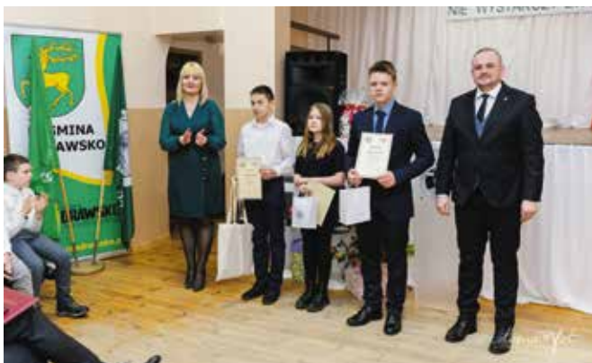
Uroczystość była okazją do nagrodzenia uczniów w konkursach