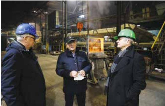
Wizyta w Odlewni Żeliwa „Drawski” S.A. w Drawskim Młynie