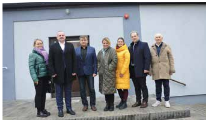
Spotkanie z Dyrektorem SP w Drawsku