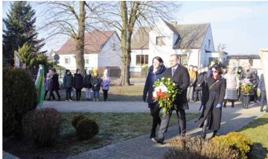
Podczas uroczystości złożono kwiaty przy obelisku Józefa Noji w Pęcckowie