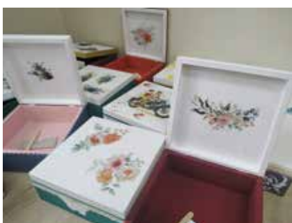
Cudne pudełka ozdobione przez Seniorów