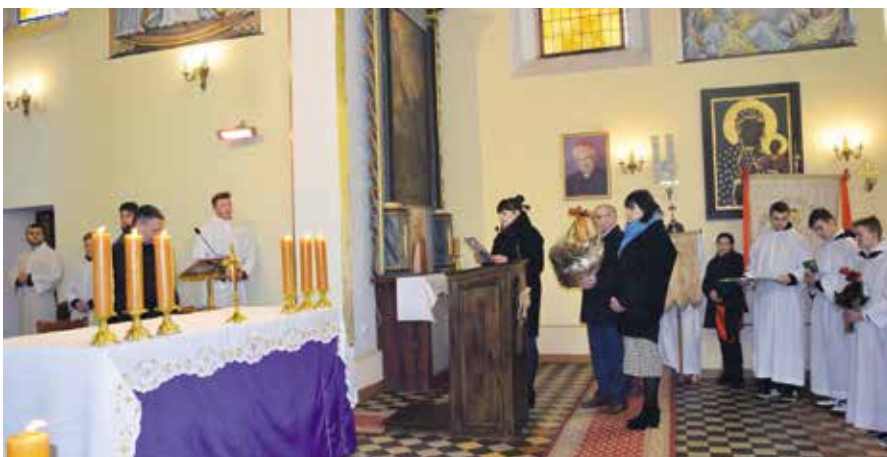
Delegacja Sołectwa Kamiennika i Kwiejc Nowych