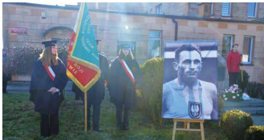
Poczet sztandarowy SP Pęcckowo podczas uroczystości