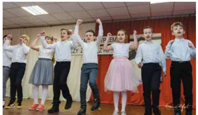
Program artystyczny zaprezentowali uczniowie SP w Pęcowie