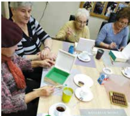
Malowanie - pod ozdoby DECOUPAGE