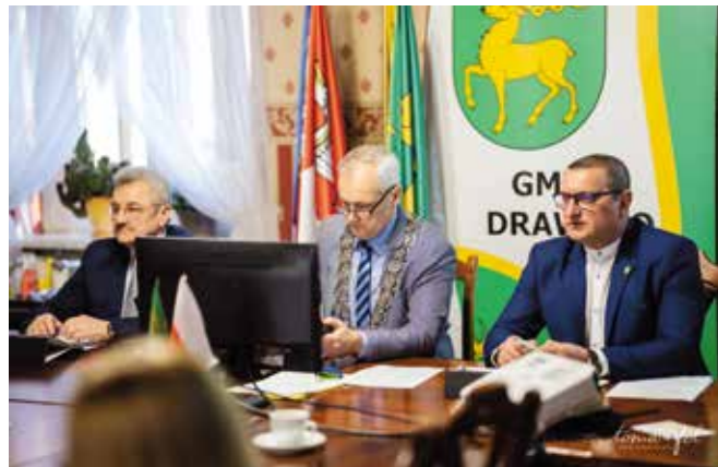
Posiedzenie XLVII zwyczajnej sesji Rady Gminy Drawsko – 15.02.2023 r.

W miesiącu lutym na wspólnym posiedzeniu Komisji Stałych Rady Gminy Drawsko omówiliśmy informacje dotyczące spełniania przez Gminę obowiązku związanego z osiągnięciem przez nauczycieli zatrudnionych w gminnych szkołach i przedszkolu średnich płac wynikających z przepisów prawa. Z przedstawionych materiałów wynikało, że średnie miesięczne płace brutto nauczycieli w roku 2022, na poszczególnych stopniach awansu powinny wynosić: w przypadku nauczyciela początkującego 4432,15 zł, w przypadku nauczyciela mianowanego 5318,58 zł i w przypadku nauczyciela dyplomowanego 6 795,97 zł. Średnia liczba etatów nauczycielskich wyniosła w tym czasie 81,95,