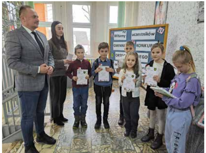
Nagrodzeni uczniowie w kategorii klas II-III