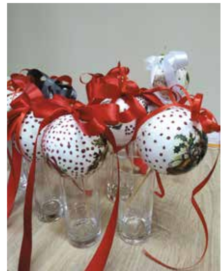
Kule ze styropianu – a to efekt końcowy, który ozdobił naszą choinkę