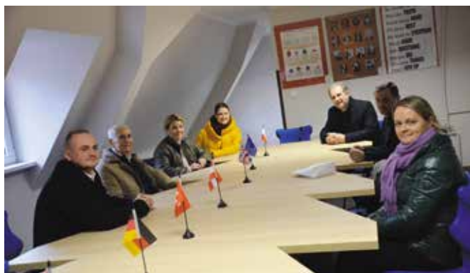
Goście odwiedzili SP w Chełście

ską flagę, która ma symbolizować początek dobrej współpracy. Zgodnie z programem wizyty odwiedziliśmy wszystkie szkoły Gminy Drawsko, w których dyrektorzy zapoznali gości z wizualnym funkcjonowaniem szkoły i procesem dydaktycznym w danej jednostce, mocnymi stronami szkoły, ale również z problemami. Liderem projektu będzie szkoła w Alytus, z Gminy Drawsko szkoła wystąpi jako partner projektu. Pierwszym etapem, od którego zaczniemy jest rejestracja szkół w programie Erasmus, a następnie wyłonienie koordynatora projektu. Partnerski projekt zostanie złożony w październiku br.