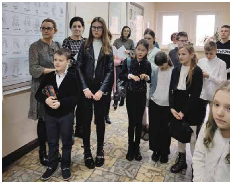
Uczestnicy Gminnego Konkursu Ortograficznego z Gminy Drawsko