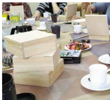
Przystępujemy do ozdoby tych surowych pudełek