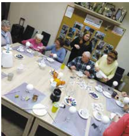
Przygotowania do pracy ze styropianowymi bombkami