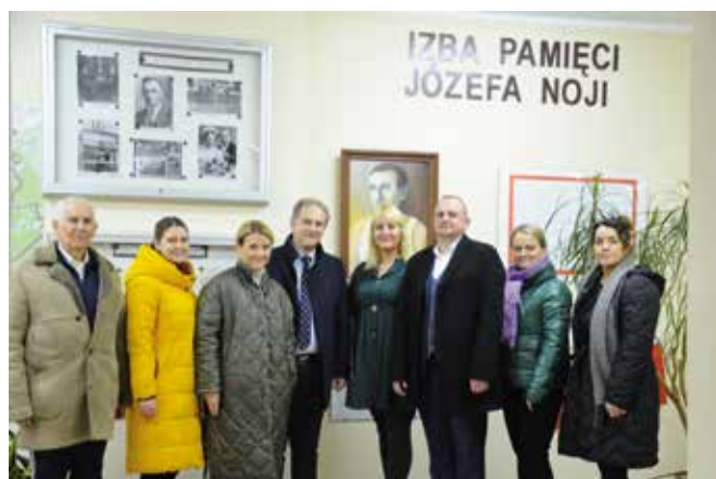
Dyrektor SP w Pęcławie zapoznała gości z funkcjonowaniem szkoły