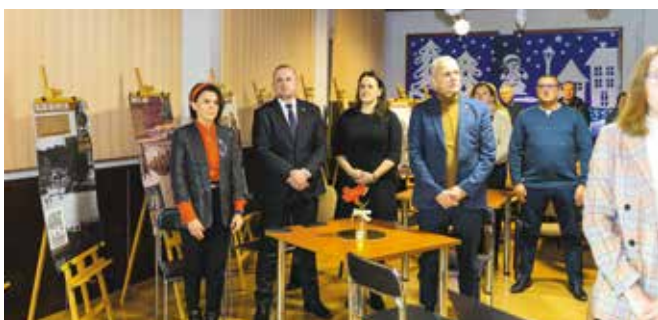
Przedstawiciele władz i mieszkańcy uczestniczący w obchodach