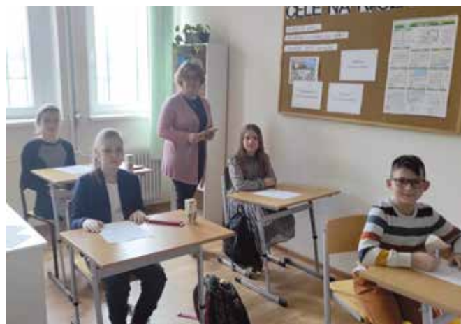
Uczniowie klas IV przed napisaniem dyktanda

Uczniowie z klas II – III zapisywali dyktowany przez nauczyciela tekst pt. „Wiosną przyroda budzi się do życia”. Natomiast starsi uczniowie pisali fragment tekstu literackiego, który pochodził z lektury omawianej na lekcjach języka polskiego: „Akademia Pana Kleksa” J. Brzechwy, „Chłopczy z Placu Broni” F. Molnara, „W pustyni i w puszczy” H. Sienkiewicza, „Latarnik” H. Sienkiewicza, „Kamienie na szaniec” A. Kamińskiego.