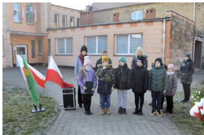
Program uczniów SP w Pęcckowie