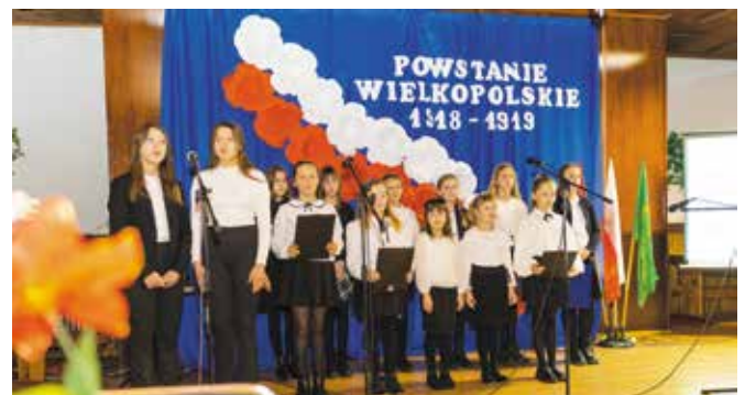
Apel słowno-muzyczny przygotowali uczniowie SP w Drawsku