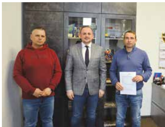
Podpisanie umowy z Gartenbruk na boisko w Drawskim Młynie i Piłce