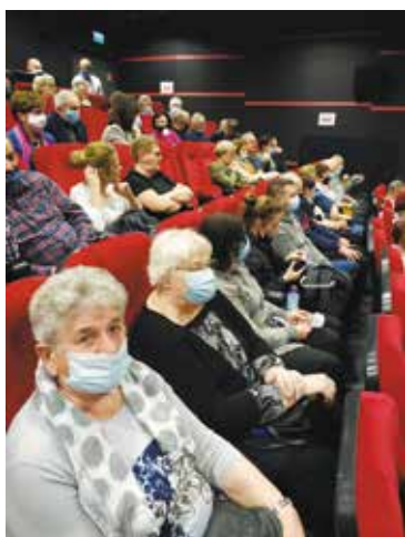
Występ Kabaretu TEY