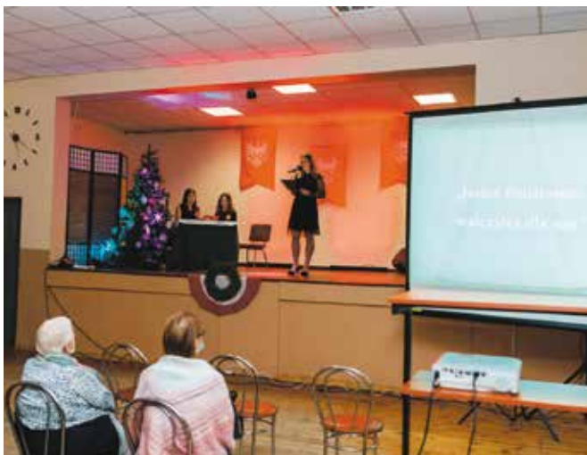
Program słowno muzyczny „ Jesteś Bohaterem, walczyłeś dla nas ”