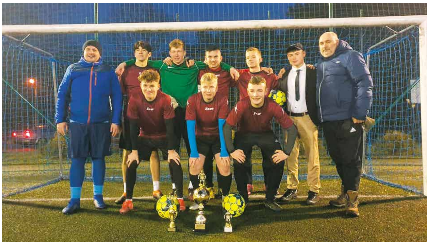
Zwycięska drużyna z Szamotuł