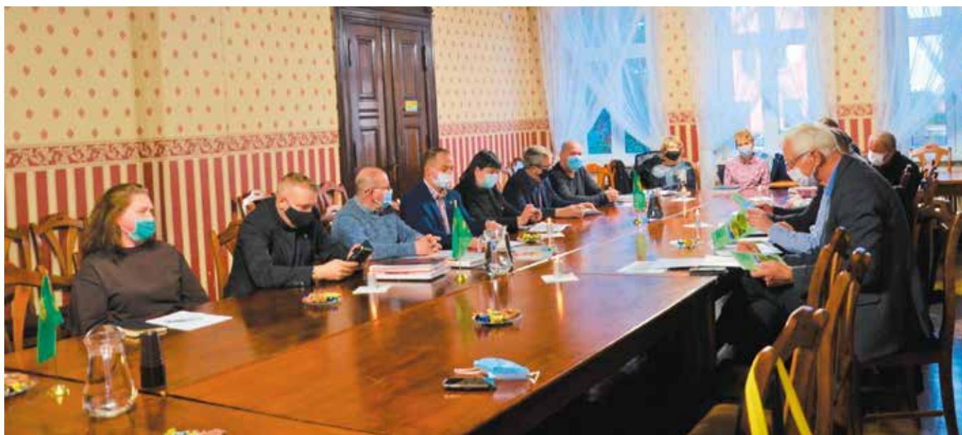
Sołtysi i goście podczas spotkania