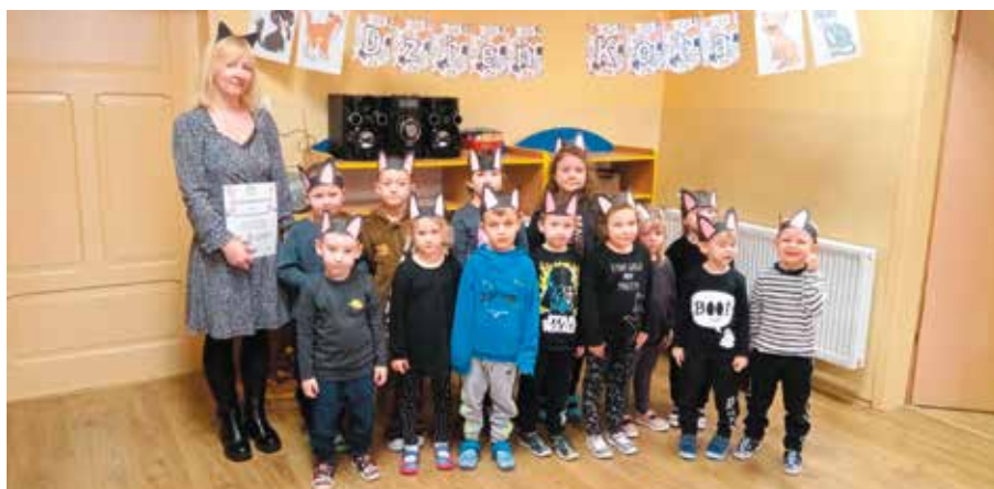
Dzień Kota w przedszkolu w Kawczynie

Dyrektor Gminnego Ośrodka Kultury, Turystyki, Rekreacji i Biblioteki Publicznej Gminy Drawsko