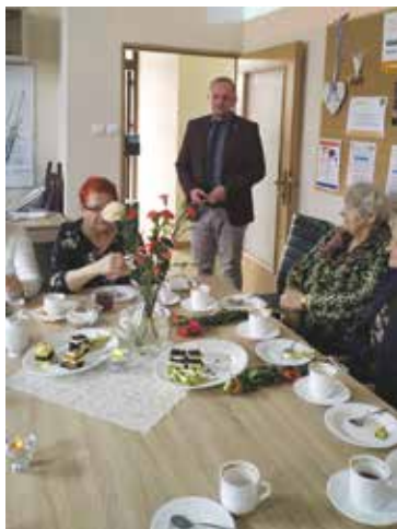
Dzień Kobiet w Klubie SENIOR + w Drawsku