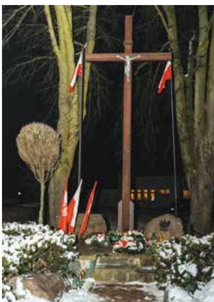
Kwiaty złożono przy Pomniku w walce o wolność Ojczyzny w Pęcckowie