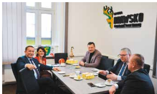
Spotkanie w Urzędzie Gminy Drawsko

Wizyta Posła, Marszałka i Przewodniczącego - gospodarska, ponieważ Goście odwiedzili „Drawski ryneček”, promenadę wybudowaną w Kawczynie przy Centrumraji, odnowioną plażę