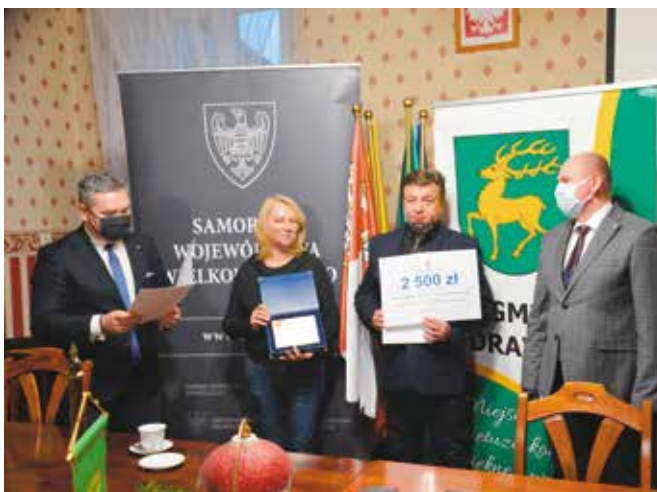
Nagrodę w wysokości 2.500 zł otrzymała Szkoła Podstawowa im. gen. dyw. Tadeusza Kutrzeby w Drawsku za realizację uczniowskiego projektu „Smog problemem współczesnego społeczeństwa”

„Działania proekologiczne są dla nas szczególnie ważne, z uwagi