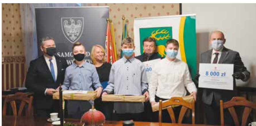
Uczniowie reprezentujący Szkołę Podstawową w Drawsku otrzymali w nagrodę za udział w projekcie laptopy