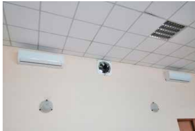
Klimatyzacja w świetlicy wiejskiej w Pęcownie