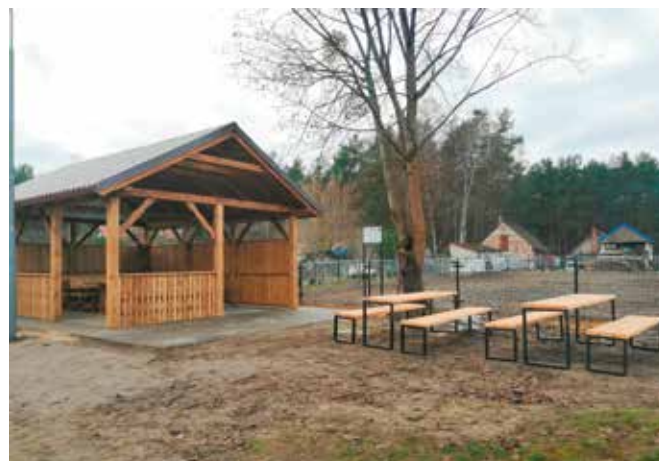
Wiata rekreacyjna przy świetlicy wiejskiej w Piłce