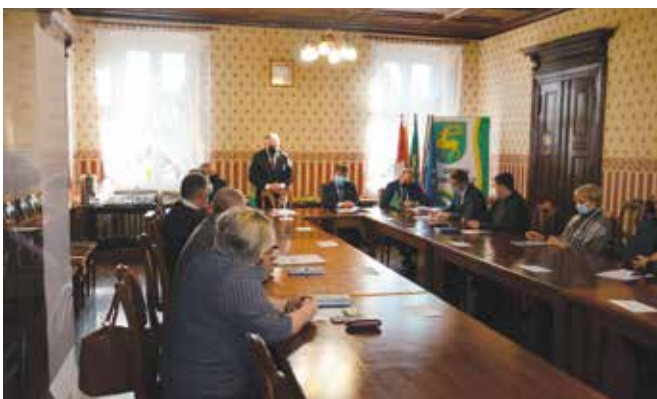
Posiedzenie wyjazdowe Komisji Zdrowia i Spraw Społecznych Powiatu Czarnkowsko-Trzcianeckiego