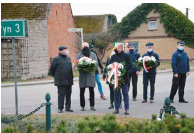
Pęcckowo, przed Obeliskiem ku czci Powstańców Wielkopolskich przy Świetlicy Wiejskiej w Pęcckowie