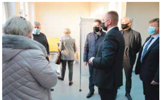
Goście obejrzeni pomieszczenia poradni