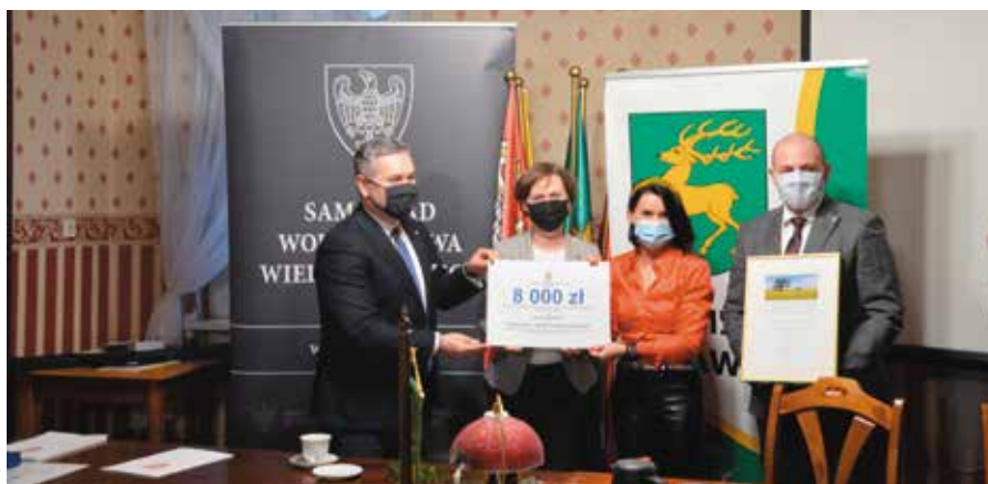
Gmina Drawsko otrzymała nagrodę w wysokości 8.000 zł z WFOŚiGW za wydarzenie „Święto Noteci - Marina Yndzel Drawsko 2019”