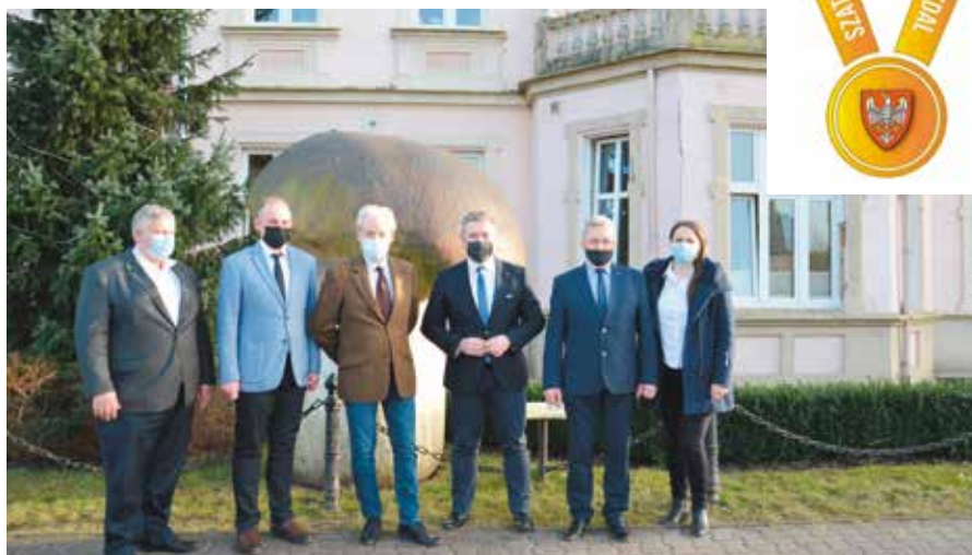
Pamiątkowe zdjęcie obok borowika przy drawskim urzędzie