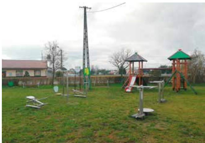
Siłownia zewnętrzna przy świetlicy wiejskiej w Pęcownie