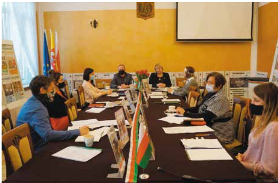
Robocze spotkanie dot. realizacji projektu